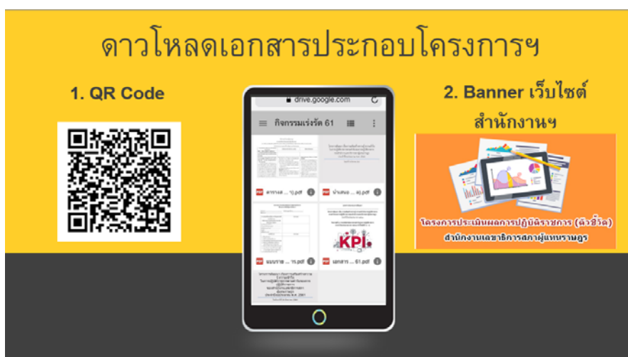
QR Code และ Banner ภายในเว็บไซต์ของสำนักงาน สำหรับดาวโหลดเอกสารประกอบโครงการฯ

คณะผู้จัดโครงการฯ ดำเนินการจัดทำเอกสารประกอบการสัมมนาโครงการฯ ด้วยการนำระบบดิจิทัล มาสนับสนุนการดำเนินงาน โดยให้ผู้เข้าร่วมโครงการสัมมนาฯ ดาวโหลดเอกสารผ่าน QR Code ที่ติดไว้ในพื้นที่โดยรอบบริเวณที่ใช้จัดสัมมนาโครงการฯ บนอุปกรณ์อิเล็กทรอนิกส์ของตนเอง เช่น โทรศัพท์มือถือ หรือ อุปกรณ์พกพาหน้าจอสัมผัส เพื่อเป็นการสนับสนุนนโยบายของรัฐบาลในการขับเคลื่อนไปสู่ระบบราชการ ๔.๐ และเป็นการลดปริมาณการใช้กระดาษด้วย