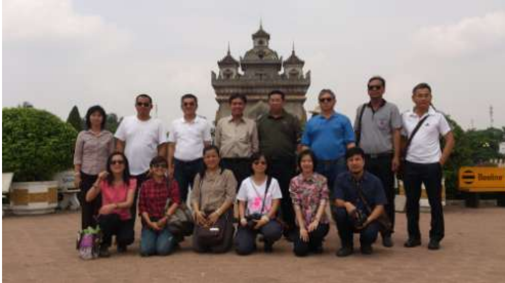
บริเวณด้านหน้าประตูชัย

ประตูชัย : "อนุสรณ์สถานเพื่อระลึกถึงประชาชนชาวลาวผู้เสียสละชีวิตในสงครามก่อนหน้าการปฏิวัติของพรรคคอมมิวนิสต์" ตั้งอยู่ทางทิศตะวันออกเฉียงเหนือของเมืองเวียงจันทน์บนถนนล้านช้างไปสิ้นสุดที่บริเวณประตูชัย สร้างเสร็จในปี พ.ศ. ๒๕๑๒