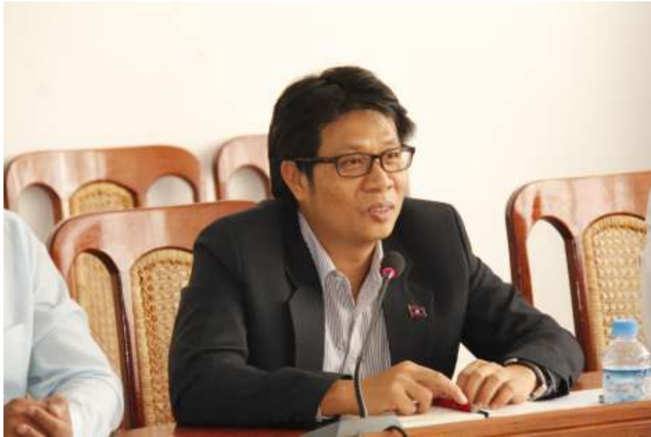
นาย Saysana Sayakone, Deputy Director General of Foreign Trade Policy Department จากกระทรวงอุตสาหกรรมและการค้า แลกเปลี่ยนความคิดเห็นเกี่ยวกับการเตรียมความพร้อมในการเข้าสู่ประชาคมเศรษฐกิจอาเซียน (AEC)