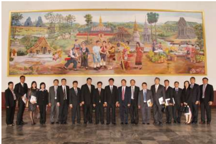
นายสุวิจักขณ์ นาควิระชัย เลขาธิการสภาผู้แทนราษฎร และคณะ ถ่ายรูปเป็นที่ระลึกร่วมกับ ดร.อุ๋นแก้ว วุฑิลาต หัวหน้าห้องว่าการสภาแห่งชาติลาว (Hon. Dr. Ounkeo Vuthilath, Chief of the Cabinet Office of the Lao National Assembly) และคณะ ณ สภาแห่งชาติ