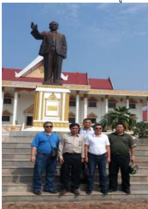
บริเวณด้านหน้าพิพิธภัณฑ์ไกสอน พมวิหาน

อนุสาวรีย์ไกสอน พมวิหาน และพิพิธภัณฑ์ไกสอน พมวิหาน ได้เปิดทำการเมื่อปี พ.ศ. ๒๕๓๘ เพื่อฉลองอายุครบ ๗๕ ปี ของอดีตประธานประเทศผู้ล่วงลับและเป็นที่เคารพ นับถือ และศรัทธาของประชาชนชาวลาว เป็นสถานที่จัดแสดงชีวประวัติตั้งแต่วัยเด็กไปจนถึงช่วงที่เป็นผู้นำในการปฏิวัติต่อต้านการปกครองของฝรั่งเศส และการปกครองระบอบกษัตริย์ที่มีสหรัฐอเมริกาหนุนหลัง การประกาศจัดตั้งสาธารณรัฐประชาธิปไตยประชาชนลาวเมื่อ ๒ ธันวาคม พ.ศ. ๒๕๑๘ และช่วงที่ดำรงตำแหน่งผู้นำ