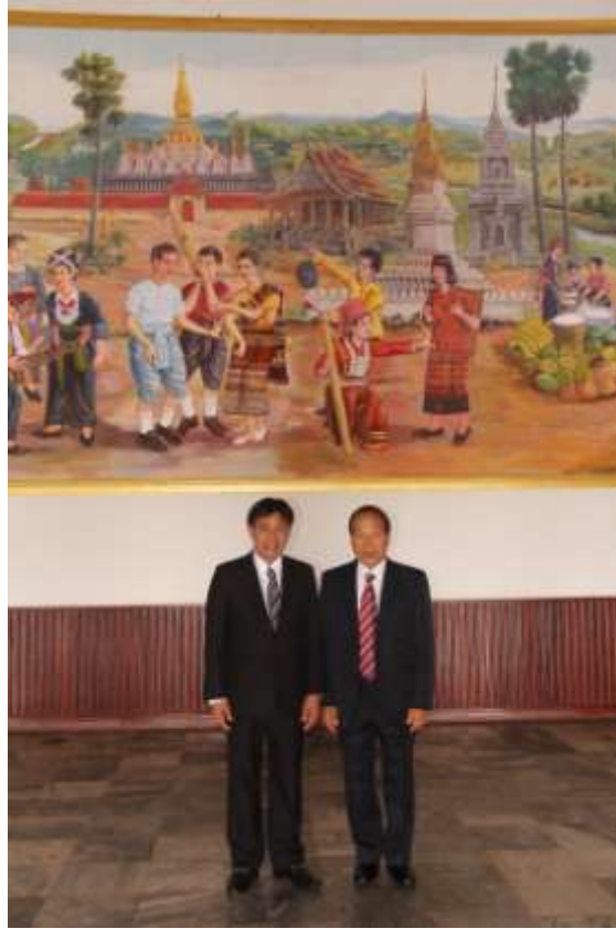
นายสุวิจักขณ์ นาควิระชัย เลขาธิการสภาผู้แทนราษฎร ถ่ายรูปเป็นที่ระลึกกับ ดร.อุ๋นแก้ว วุฑิลาต หัวหน้าห้องว่าการสภาแห่งชาติลาว (Hon. Dr. Ounkeo Vuthilath, Chief of the Cabinet Office of the Lao National Assembly) ณ สภาแห่งชาติ