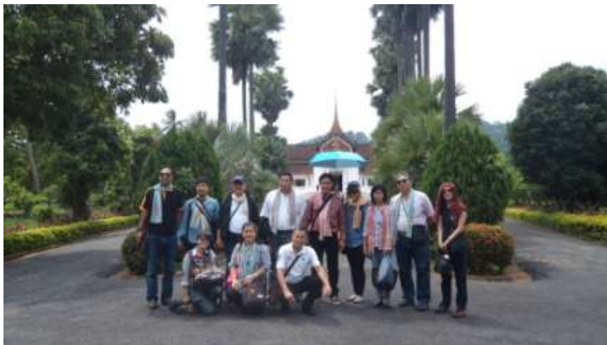
บริเวณทางเข้าพิพิธภัณฑสถานหลวงพระบาง

อาคารสถาปัตยกรรมโคโลเนียลอดีตพระราชวังหลวง สร้างขึ้นในปี ค.ศ. ๑๙๐๔ สมัยเจ้ามหาชีวิตศรีสว่างวงศ์ ออกแบบโดยสถาปนิกชาวฝรั่งเศสเป็นอาคารชั้นเดียวยกสูงแบบสถาปัตยกรรมฝรั่งเศสและลาว หลังคายอดปราสาทเป็นศิลปะลาวล้านช้าง ต่อมาเมื่อเปลี่ยนแปลงการปกครองพระราชวังแห่งนี้จึงถูกเปลี่ยนเป็นพิพิธภัณฑสถานหลวงพระบาง ภายในจัดแสดงเป็นห้องต่าง ๆ รวมถึงป้ายบรรยายประวัติและข้าวของเครื่องใช้ของเจ้ามหาชีวิต