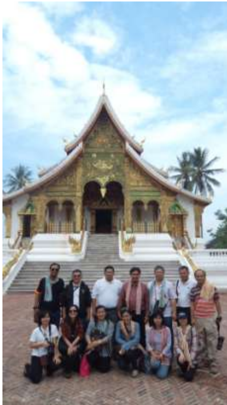
บริเวณหน้าหอพระบาง