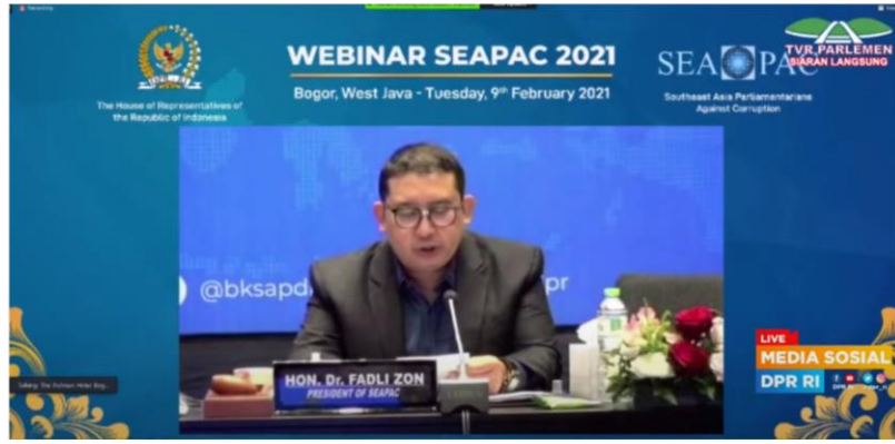
ดร. Fadli Zon สมาชิกรัฐสภาอินโดนีเซีย และประธาน SEAPAC กล่าวเปิดการสัมมนา

จากนั้นเป็นการฉายคลิปวิดีโอที่ศรศ.กล่าวเปิดประชุมโดย ดร. H.C. Puan Maharani ประธานสภาผู้แทนราษฎรอินโดนีเซีย มีสาระสำคัญเกี่ยวกับบทบาทและหน้าที่ของสมาชิกรัฐสภา ที่เป็นพันธมิตรร่วมมือกันในภูมิภาคเอเชียตะวันออกเฉียงใต้ด้านการต่อต้านการทุจริต ทั้งนี้ การทุจริตสามารถเกิดขึ้นได้ตลอดเวลา สมาชิกรัฐสภาจำเป็นต้องแสดงบทบาทอย่างจริงจังและเข้มแข็งในการต่อต้านการทุจริตและจัดการผลกระทบที่จะเกิดต่อประชาชน ซึ่งอาจกระทบต่อโอกาสทางเศรษฐกิจและธรรมาภิบาลเช่นกัน ทั้งนี้ในระดับโลก สมาชิกรัฐสภาถือเป็นกลไกหลักที่จะร่วมมือกันอย่างจริงจังเพื่อต่อต้านการทุจริต เช่นเดียวกับในระดับประเทศ รัฐสภาอินโดนีเซียเป็นกลไกสำคัญเพื่อแสดงพลังการสนับสนุนในการต่อต้านการทุจริต และส่งเสริมความร่วมมือระหว่างประเทศที่จะร่วมกันพัฒนาโลก ในวาระของการประชุม UNGASS 2021 ว่าด้วยการต่อต้านการทุจริตที่จะจัดขึ้นในเดือนมิถุนายน ๒๕๖๔ นับเป็นโอกาสอันดีที่สมาชิกรัฐสภาทั่วโลกจะร่วมกันสนับสนุนอย่างแข็งขัน ทั้งนี้ วิกฤตการแพร่ระบาดของโรคติดเชื้อไวรัสโคโรนา ๒๐๑๙ ส่งผลให้รัฐบาลในหลายประเทศเร่งรัดดำเนินการด้านงบประมาณเพื่อฟื้นฟูเศรษฐกิจ ซึ่งอาจมีผลกระทบที่ตามมาจากการใช้งบประมาณในทางที่ผิดหรือเกิดการทุจริตขึ้นได้ ดังนั้น รัฐสภาจำเป็นต้องดำเนินการเพื่อตรวจสอบการบริหารของภาครัฐ โดย (๑) สร้างความเข้มแข็งในการตรวจสอบการทำงานของฝ่ายบริหาร (๒) สร้างความโปร่งใสตรวจสอบได้ และ (๓) สร้างธรรมาภิบาลทั้งภาคส่วนรัฐบาลและเอกชน เพื่อขยายการบูรณาการในการจัดการปัญหาโรคโควิด-๑๙ ดังนั้น SEAPAC จะเป็นเวทีในการแบ่งปันแนวคิดและประสบการณ์เพื่อสร้างแนวทางในการต่อต้านการทุจริตร่วมกันในภูมิภาคในช่วงเวลาดังกล่าว