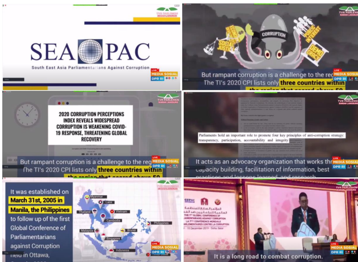
คลิปวิดีโอทัศน์แนะนำองค์การ SEAPAC

ก่อนเริ่มต้นช่วงการอภิปรายได้มีการฉายคลิปวิดีโอทัศน์แนะนำองค์การ SEAPAC ซึ่งเป็นเครือข่ายความร่วมมือของสมาชิกรัฐสภาเพื่อการต่อต้านการทุจริตในภูมิภาคเอเชียตะวันออกเฉียงใต้ มีจุดมุ่งหมายร่วมกันในการต่อต้านการทุจริตและการเสริมสร้างธรรมาภิบาล โดยมีข้อผูกพันที่จะต่อต้านการทุจริตและส่งเสริมความโปร่งใสและการตรวจสอบได้ เพื่อสร้างมาตรฐานที่มีคุณภาพในการบูรณาการการจัดการภาครัฐและธรรมาภิบาล SEAPAC เชื่อมันว่ารัฐสภาเป็นกลไกดำเนินการที่สำคัญที่จะส่งเสริมยุทธศาสตร์และแผนดำเนินการเชิงรุก ตลอดจนการดำเนินการอย่างเหมาะสมเพื่อบรรลุด้านภาพที่ยั่งยืนในบริบทสังคมระหว่างประเทศ ปัจจุบัน SEAPAC มีประเทศสมาชิกที่มีหน่วยประจำชาติ จำนวน ๔ ประเทศ ได้แก่ อินโดนีเซีย มาเลเซีย ฟิลิปปินส์ และติมอร์เลสเต มีสำนักงานเลขาธิการตั้งอยู่ที่กรุงจาการ์ตา สาธารณรัฐอินโดนีเซีย