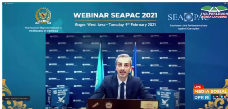
นาย Francesco Checchi ที่ปรึกษาระดับภูมิภาคว่าด้วยการต่อต้านการทุจริต สำนักงานว่าด้วยยาเสพติดและอาชญากรรมแห่งสหประชาชาติ ร่วมอภิปรายต่อที่ประชุม

ดังนั้น GOPAC ในฐานะเป็นองค์การความร่วมมือเพื่อต่อต้านการทุจริตในระดับโลกที่มีสมาชิกรัฐสภาผู้ทำหน้าที่ฝ่ายนิติบัญญัติในการตรวจสอบและควบคุมการทำงานของฝ่ายบริหาร ตลอดจนการดูแลการกำหนดนโยบายและการบังคับใช้กฎหมายให้เกิดประสิทธิผล จึงเป็นกลไกสำคัญที่ทำหน้าที่ด้านนิติบัญญัติเพื่อปกป้องผลประโยชน์ของประชาชน ในกรอบความร่วมมือด้านการต่อต้านการทุจริตทั้งในประเทศและระหว่างประเทศ ในโอกาสนี้ สมาชิกรัฐสภาจำเป็นต้องทบทวนบทบาทในการจัดการปัญหาการทุจริตภายใต้สถานการณ์การแพร่ระบาดของโรคโควิด-๑๙ ซึ่งรัฐบาลหลายประเทศได้มีแนวนโยบายจัดสรรงบประมาณเพื่อฟื้นฟูประเทศ รัฐสภาจึงจำเป็นต้องทำหน้าที่ในการควบคุมและตรวจสอบอย่างใกล้ชิดว่างบประมาณเหล่านี้จะปราศจากการทุจริตตามที่ UNCAC ระบุไว้ เพื่อส่งเสริมกระบวนการให้เกิดผลตามอนุสัญญาฯ และนำไปสู่การบรรลุเป้าหมายการพัฒนาที่ยั่งยืน เป้าหมายที่ ๑๖ เพื่อส่งเสริมสังคมที่สงบสุข มีความยุติธรรม โดยปราศจากการทุจริต