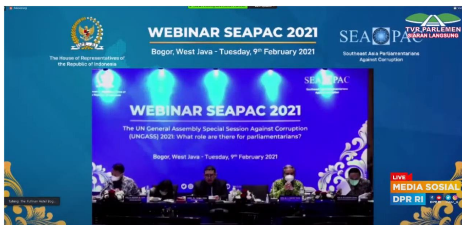
ผู้เข้าร่วมการสัมมนา Webinar ในห้องประชุม ณ เมืองโบกอร์ สาธารณรัฐอินโดนีเซีย