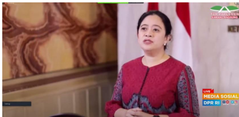
ดร. H.C. Puan Maharani ประธานสภาผู้แทนราษฎรอินโดนีเซีย กล่าวเปิดการสัมมนา

จากนั้นเป็นการฉายคลิปวิดีโอที่ศรศ.กล่าวเปิดประชุมโดย ดร. H.C. Puan Maharani ประธานสภาผู้แทนราษฎรอินโดนีเซีย มีสาระสำคัญเกี่ยวกับบทบาทและหน้าที่ของสมาชิกรัฐสภา ที่เป็นพันธมิตรร่วมมือกันในภูมิภาคเอเชียตะวันออกเฉียงใต้ด้านการต่อต้านการทุจริต ทั้งนี้ การทุจริตสามารถเกิดขึ้นได้ตลอดเวลา สมาชิกรัฐสภาจำเป็นต้องแสดงบทบาทอย่างจริงจังและเข้มแข็งในการต่อต้านการทุจริตและจัดการผลกระทบที่จะเกิดต่อประชาชน ซึ่งอาจกระทบต่อโอกาสทางเศรษฐกิจและธรรมาภิบาลเช่นกัน ทั้งนี้ในระดับโลก สมาชิกรัฐสภาถือเป็นกลไกหลักที่จะร่วมมือกันอย่างจริงจังเพื่อต่อต้านการทุจริต เช่นเดียวกับในระดับประเทศ รัฐสภาอินโดนีเซียเป็นกลไกสำคัญเพื่อแสดงพลังการสนับสนุนในการต่อต้านการทุจริต และส่งเสริมความร่วมมือระหว่างประเทศที่จะร่วมกันพัฒนาโลก ในวาระของการประชุม UNGASS 2021 ว่าด้วยการต่อต้านการทุจริตที่จะจัดขึ้นในเดือนมิถุนายน ๒๕๖๔ นับเป็นโอกาสอันดีที่สมาชิกรัฐสภาทั่วโลกจะร่วมกันสนับสนุนอย่างแข็งขัน ทั้งนี้ วิกฤตการแพร่ระบาดของโรคติดเชื้อไวรัสโคโรนา ๒๐๑๙ ส่งผลให้รัฐบาลในหลายประเทศเร่งรัดดำเนินการด้านงบประมาณเพื่อฟื้นฟูเศรษฐกิจ ซึ่งอาจมีผลกระทบที่ตามมาจากการใช้งบประมาณในทางที่ผิดหรือเกิดการทุจริตขึ้นได้ ดังนั้น รัฐสภาจำเป็นต้องดำเนินการเพื่อตรวจสอบการบริหารของภาครัฐ โดย (๑) สร้างความเข้มแข็งในการตรวจสอบการทำงานของฝ่ายบริหาร (๒) สร้างความโปร่งใสตรวจสอบได้ และ (๓) สร้างธรรมาภิบาลทั้งภาคส่วนรัฐบาลและเอกชน เพื่อขยายการบูรณาการในการจัดการปัญหาโรคโควิด-๑๙ ดังนั้น SEAPAC จะเป็นเวทีในการแบ่งปันแนวคิดและประสบการณ์เพื่อสร้างแนวทางในการต่อต้านการทุจริตร่วมกันในภูมิภาคในช่วงเวลาดังกล่าว