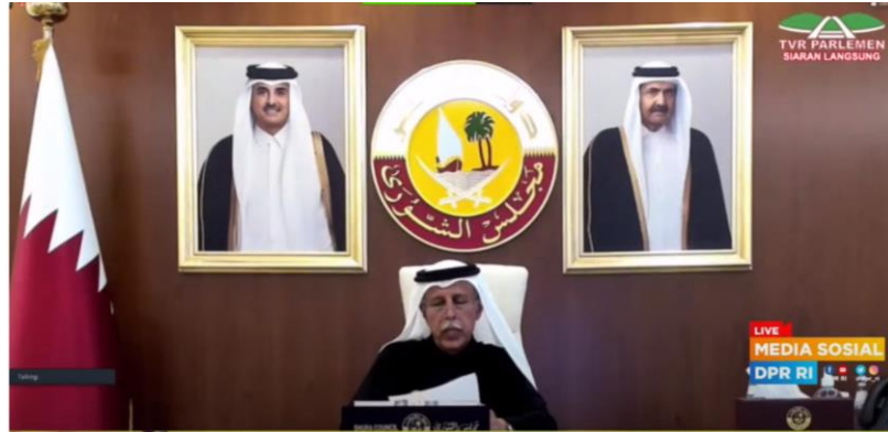
นาย Ahmad Bin Abdulla bin Zaid Al-Mahmoud สมาชิกรัฐสภา ประธาน GOPAC และประธานสภา Shura แห่งรัฐกาตาร์ กล่าวเปิดการสัมมนา

ร่วมมือกันส่งเสริมพลังผลักดันให้สมาชิกรัฐสภาสนับสนุนให้เกิดกระแสความเปลี่ยนแปลงในการต่อต้านการทุจริตในสังคม โดยที่ GOPAC SEAPAC และหน่วยประจำชาติในภูมิภาคต่าง ๆ จะผนึกกำลังร่วมมือกันเพื่อสร้างเครือข่ายความร่วมมือในการทำงานและสร้างพันธมิตร เพื่อส่งเสริมภารกิจของฝ่ายนิติบัญญัติให้ก้าวหน้าและทันต่อยุคสมัยในอนาคต