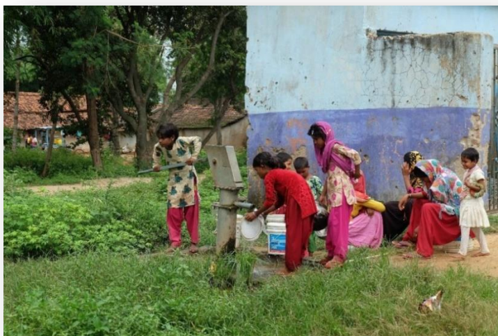
ภาพที่ ๓ หน้าที่ของผู้หญิงและเด็กต้องมารองน้ำบาดาล ที่มา : the 101.world/woman-rights-india

อุปสรรคและความท้าทายใหม่ ๆ ต่อการเปลี่ยนแปลงภาพลักษณ์และสถานะของสตรีในสังคมอินเดียที่ยังคงวนเวียนอยู่ในความคิดของคนหลายคนที่อาจจะสงสัยว่า สังคมอินเดียเป็น “สังคมประชาธิปไตยที่ใหญ่ที่สุดตามจำนวนประชากรที่มากที่สุดในโลก” กลับมีการรับรู้เรื่องสิทธิสตรีไม่มากเท่าที่ควร ภาพข่าวเด็กหญิงและแม่บ้านชาวอินเดีย ยังต้องเดินทางไปในถิ่นทุรกันดาร แห่งแล้งที่ไกล ๆ ออกไป เพื่อมารองน้ำบาดาลไปใช้ในบ้าน ภาพเหล่านี้สะท้อนให้เห็นถึงหน้าที่ระหว่างชายหญิงในสังคมอินเดียโบราณที่ผู้หญิงมีหน้าที่สำคัญ คือ เมื่อเกิดมาแล้วต้องเป็นภรรยาที่ดีของสามี สตรีจะสามารถเอาชีวิตรอดได้ก็ด้วยการแต่งงานมีสามีและครอบครัวที่ดี จากความเชื่อแบบนี้ ทำให้สังคมอินเดียผลักดันลูกสาวให้มีสามีโดยเร็วตั้งแต่อายุยังน้อย