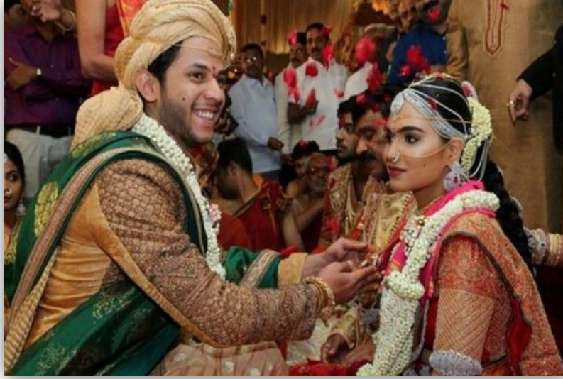
ภาพที่ ๖ ขั้นตอนพิธีการแต่งงาน