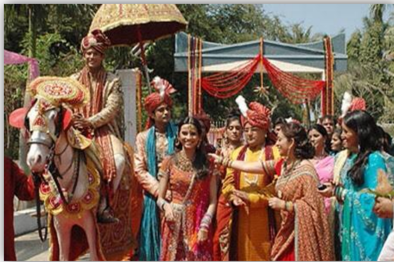
ภาพที่ ๕ เจ้าสาวเดินทางไปขอเจ้าบ่าว