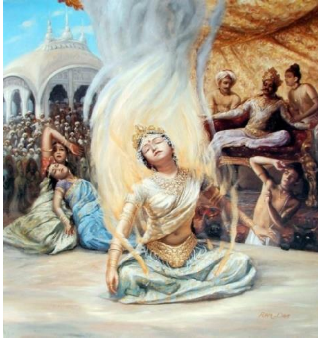
ภาพที่ ๑ นางสีดาลุยไฟ