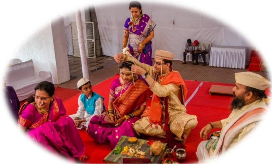
ภาพที่ ๔ พิธีมอบสินสอดของชาวอินเดีย