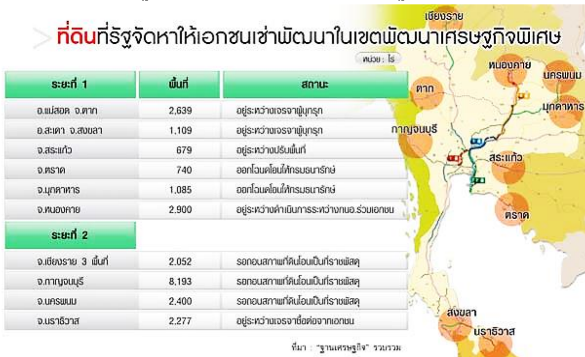
ภาพที่ 1 : ที่ดินที่รัฐจัดหาให้เอกชนเช่าพัฒนาในเขตพัฒนาเศรษฐกิจพิเศษ