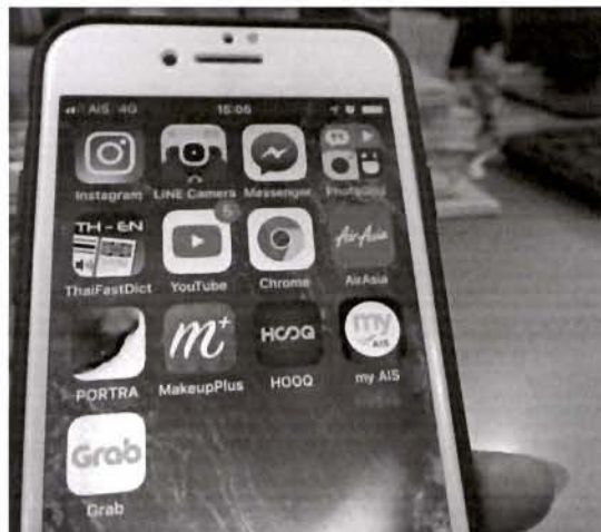
ภาพที่ 1 แอปพลิเคชันของ Grab รูปแบบใหม่ของการใช้บริการด้านขนส่ง

การแข่งขันกันด้านคมนาคมในหลายปีที่ผ่านมา หลายคนเห็นช่องทางความไม่สะดวกสบาย การขาดมาตรฐานของระบบขนส่งมวลชนที่ให้บริการอยู่และเริ่มมองหาทางเลือกที่ดีกว่า ทำให้บริษัทยักษ์ใหญ่ ผู้นำด้านแพลตฟอร์มการขนส่งในภูมิภาคเอเชียตะวันออกเฉียงใต้เห็นช่องทางและช่องว่างทางกฎหมาย จึงมาลงทุนด้านการให้บริการ การขนส่งในหลากหลายรูปแบบ ประกอบกับสภาพปัจจุบันการใช้ชีวิตในยุค แห่งกระแสดิจิทัลทำให้รูปแบบการซื้อขายและบริการต่าง ๆ ย่อมมีการปรับเปลี่ยนให้เข้ายุคสมัยมากขึ้น