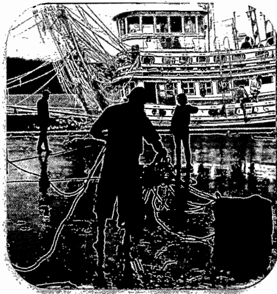
ภาพที่ 1 แรงงานประมง

นางสาวโสธรา พิภลหอม วิทยากรปฏิบัติการ กลุ่มงานบริการวิชาการ 3 สำนักวิชาการ