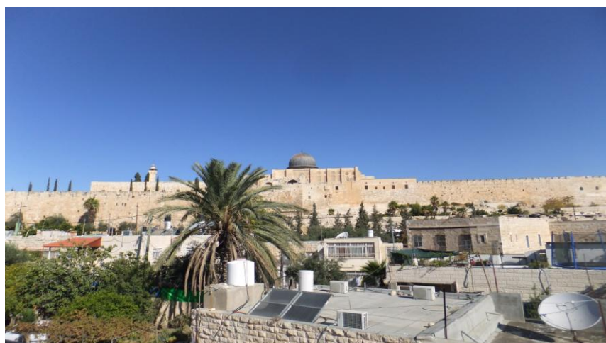
ย่านเมืองเก่านครเยรูซาเลม (City of David)