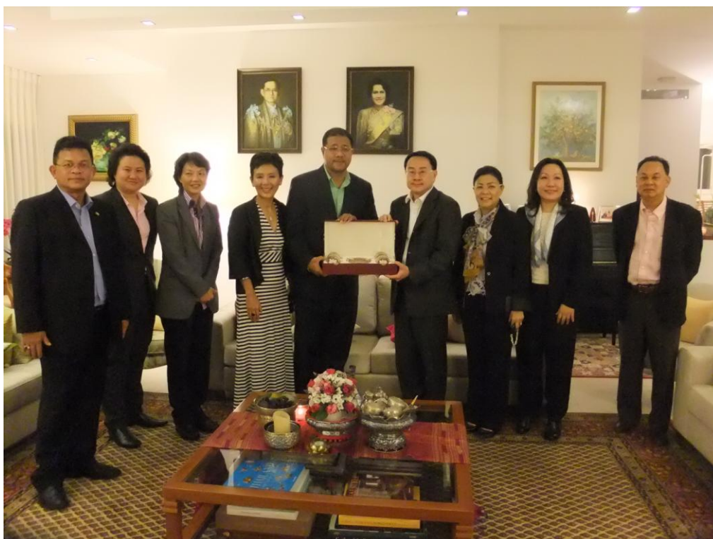
นายจักร บัญ-หลง เอกอัครราชทูต ณ กรุงเทลอาวีฟ เป็นเจ้าภาพเลี้ยงรับรองอาหารค่ำ เพื่อเป็นเกียรติแก่คณะผู้แทนกลุ่มมิตรภาพฯ ไทย-อิสราเอล ณ ทำเนียบเอกอัครราชทูต