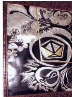
Das Symbol der Handlungen und der Wirtschaft unter der Gleichberechtigung und der Richtigkeit, die durch die Waagschale gezeichnet wird.

Das Bild des Rades der ewigen Wiederkehr und Symbol für andere Religionen, die durch das Kreuz und die Liane dargestellt werden. Es steht für die Religionen der thailändischen Leute.