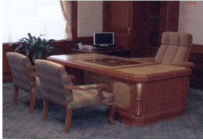
Arbeitszimmer des ersten stellvertretenden Sprechers der Abgeordnetenkammer