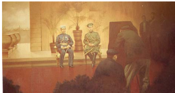
König Rama V: Besuch in Russland und Bild von ihm mit Zar Nicholas II.