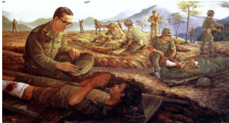
König Rama IX zu Besuch bei Soldaten, die Verletzung beim der Verteidigen der nationalen Sicherheit erlitten haben.