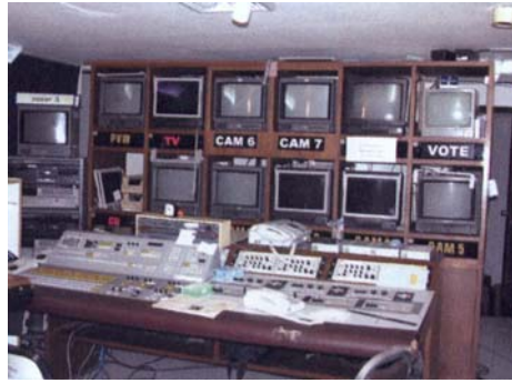
Kontrollzimmer des parlamentarischen Versammlungsraums und der abgeschlossenen Fernsehsausrüstung.