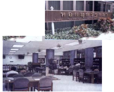
Bibliothek der Nationalversammlung

Das dritte parlamentarische Gebäude ist ein siebenstöckiges Gebäude. Es besteht aus budgetierendem Sitzungsraum, Arbeitszimmer und Sitzungsraum der Ausschüsse.