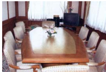
Arbeitszimmer für den Sprecher der Regierung