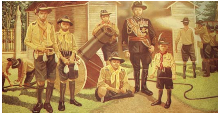
König Rama VI organisierte eine Gruppe von Pfadfindern aus verschiedenen Regionen im Königreich.