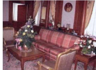
Arbeitszimmer des Parlamentspräsidenten