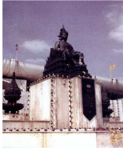
Das Standbild des Königs Prajadhipok

Das Standbild des Königs Prajadhipok ist vor dem ersten parlamentarischen Gebäude aufgebaut. Der König Prajadhipok, der Barmherzigkeit durch das Opfern seiner Macht zeigte, lässt das Land zur verfassungsmäßigen demokratischen Form von Regierung übergehen.