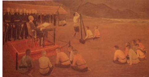
König Rama IV: Beobachtung der Sonnenfinsternis im Unterbezirk Wakor.