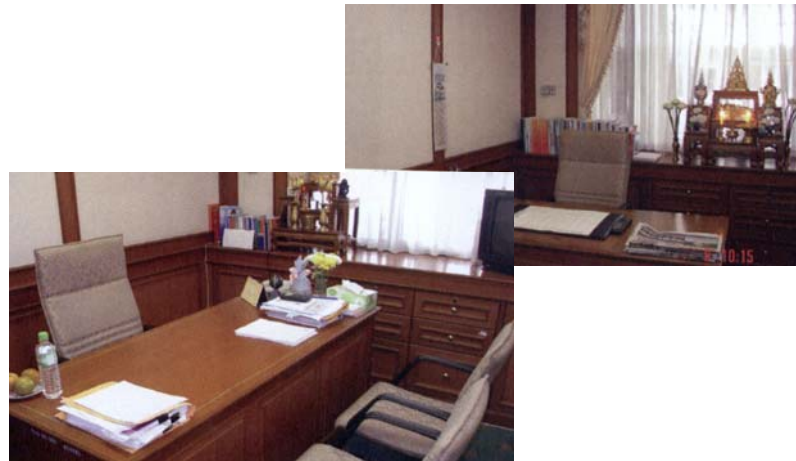
Arbeitszimmer für die Vorsitzenden der verschiedenen Ausschüsse