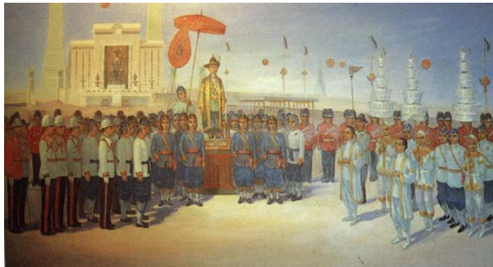
König Rama VII eröffnete die sogenannte Pathom Borom Rajanusorn Brücke.