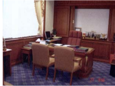
Arbeitszimmer des zweiten stellvertretenden Sprechers der Abgeordnetenkammer