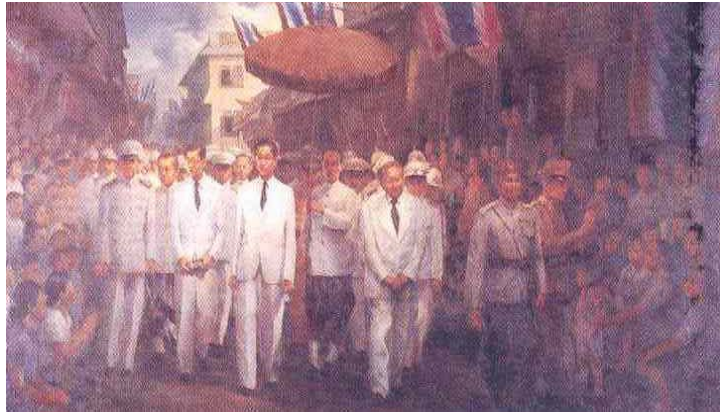
König Rama VIII zu Besuch in China Town im Sampeng Gebiet.