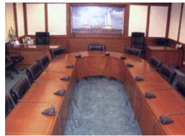
Arbeitszimmer des Vorsitzenden des Oppositions -Sprechers

E – Knowledge Service Versorgung mit Informationen für die Abgeordneten