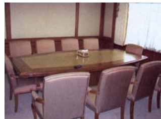
Empfangszimmer für den Premierminister und für den Ministerrat