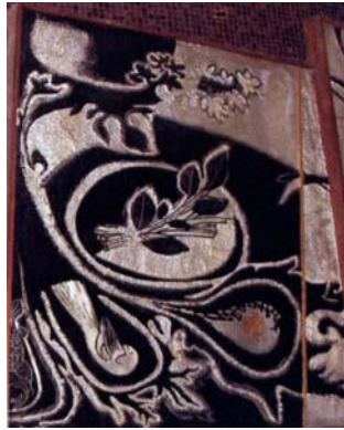
Dieses Bild symbolisiert den Anfang der Entwicklung des Landes.