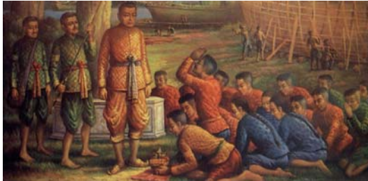
König Rama III bei der Leitung des Hafens für den Handel mit chinesischen Schiffahrtsleuten.