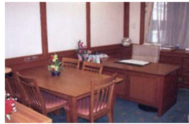
Arbeitszimmer der Vorsitzenden der Ausschüsse