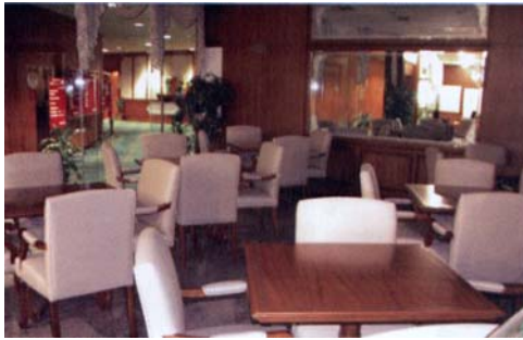
Cafeteria der Abgeordnetenversammlung