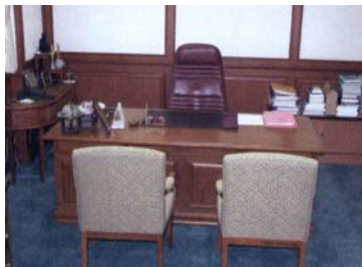
Arbeitszimmer des Oppositionsführers