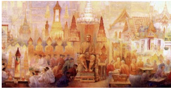
König Rama I Die Gründung der Stadt

Es gibt 50 Malereien im parlamentarischen Versammlungsraum im ersten und zweiten Stockwerk. Es zeigt Aktivitäten von den Königen Rama I-IX der Chakri Dynastie. Es gibt Ölmalereien von den vielen berühmten Künsten. Die Malereien wurden zum Sekretariat des Parlaments durch das Vize-Komitee des thailändischen Königs anlässlich der Rattanakosin-zweihundertjährigen Feier im Jahr 1982 gebracht. Die Absicht war, die Bevölkerung an die Leistungen aller thailändischen Könige Thailands und deren Leute zu erinnern.