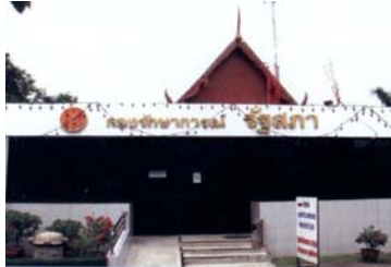
Bild vom Eingangshaus

Es liegt an der linken Seite des Eingangs des Parlaments und wird als Informationsgeber und Ausgabestelle der Besucherkarte für das Parlament genutzt.