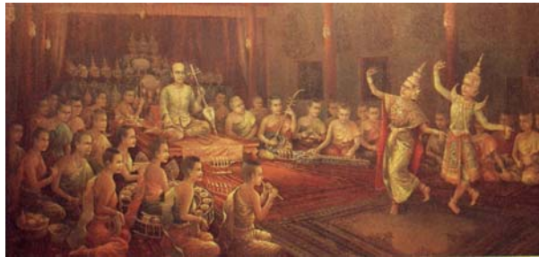
König Rama II Förderung der Thai-Musik und des Thai-Tanzens