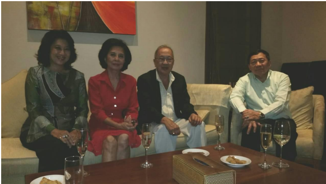
ภาพ : เจ้าหญิงนโรดม มารี (บุคคลที่ ๒ จากทางซ้าย) ฉายพระรูปร่วมกับ คณะผู้แทนกลุ่มมิตรภาพสมาชิกรัฐสภาไทย - กัมพูชา

เศรษฐกิจกัมพูชาอยู่ในระดับที่ดีขึ้นแต่การขยายตัวทางเศรษฐกิจอยู่ในระดับต่ำ ปัญหาความยากจนยังคงเป็นปัญหาสำคัญของประชาชนกัมพูชา สภาพเศรษฐกิจในภาพรวมยังไม่ดีนัก ปัญหาการกระจายรายได้ไม่เท่าเทียมกัน และมีช่องว่างระหว่างรายได้ของคนรวยกับคนจนสูง โดยประชากรส่วนใหญ่มากกว่าร้อยละ ๗๐ ของประเทศมีฐานะยากจน แต่สัดส่วนของผู้มีรายได้ระดับปานกลางถึงระดับสูงมีจำนวนเพิ่มมากขึ้น ภาคธุรกิจและอุตสาหกรรมหลักของกัมพูชา ได้แก่ สิ่งทอ เกษตรแปรรูป ก่อสร้าง และท่องเที่ยว รวมถึง กลุ่มสินค้าอุปโภคบริโภค เนื่องจากกัมพูชาขาดอุตสาหกรรมการผลิตภายในประเทศ จึงจำเป็นต้องนำเข้าสินค้าอุปโภคและบริโภค ซึ่งกัมพูชามีการนำเข้าสินค้าจากประเทศไทยเป็นจำนวนมาก ธุรกิจด้านอาหารเป็นอีกธุรกิจที่น่าสนใจในกัมพูชา เพื่อรองรับชาวกัมพูชาที่มีรายได้ระดับปานกลางขึ้นไป รวมถึง นักธุรกิจและนักท่องเที่ยวต่างชาติในกัมพูชา