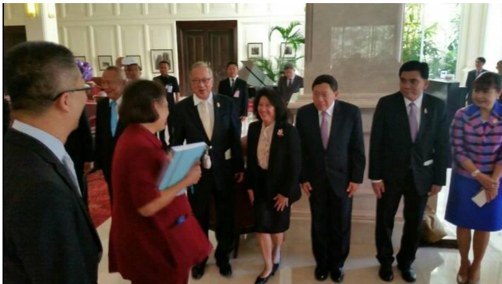
ภาพ : ร่วมรับเสด็จฯ สมเด็จพระเทพรัตนราชสุดาฯ สยามบรมราชกุมารี

๕.๑ งานกาล่าดินเนอร์เฉลิมพระเกียรติสมเด็จพระเทพรัตนราชสุดาฯ สยามบรมราชกุมารี เมื่อวันที่ ๒๓ กุมภาพันธ์ ๒๕๕๙ เวลา ๑๘.๐๐ นาฬิกา ณ โรงแรมโซฟิเทล พนมเปญ โทคีธรา กรุงพนมเปญ ราชอาณาจักรกัมพูชา