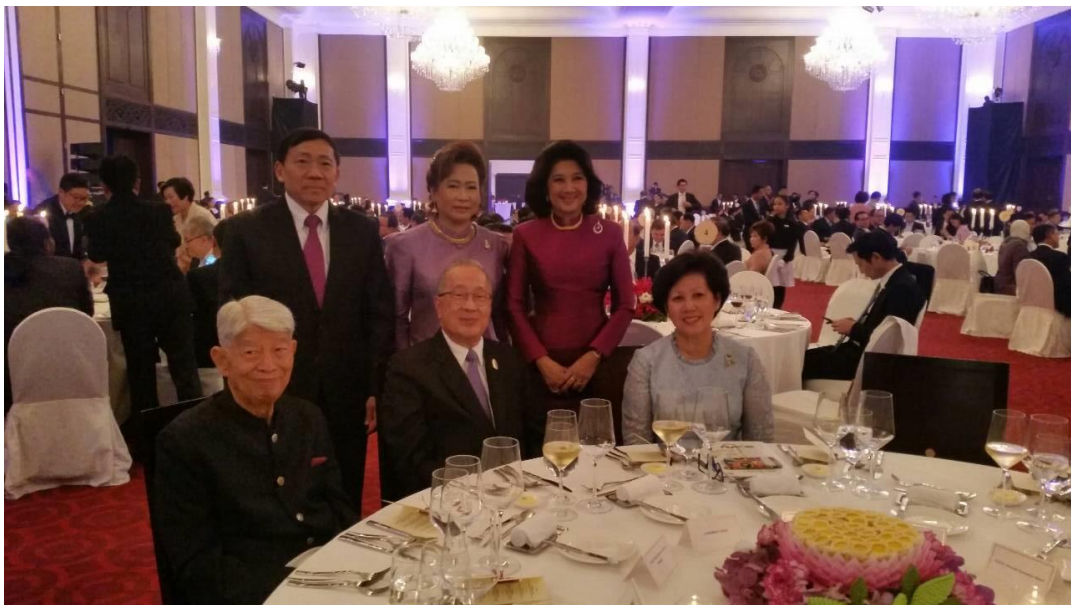
ภาพ : สมเด็จพระนโรดม อรุณรัศมี (บุคคลนั่งคนแรกทางด้านขวา) ฉายพระรูปร่วมกับ คณะผู้แทนกลุ่มมิตรภาพสมาชิกรัฐสภาไทย – กัมพูชา

ในการร่วมโต๊ะเสวยกับสมเด็จพระนโรดม อรุณรัศมี (H.R.H. Samdech Reach Botrey Preah Anoch Norodom Arun Reasmey) พระชนิษฐาของพระบาทสมเด็จพระบรมนาถ นโรดม สีหมุนี คณะได้พูดคุยเกี่ยวกับเรื่องการเมืองของกัมพูชา ซึ่งสมเด็จพระนโรดม อรุณรัศมี เคยดำรงตำแหน่งหัวหน้าพรรค ฟุนซินเปก (FUNCINPEC) รวมถึง ปัญหาในเรื่องการบริหารงานของสำนักพระราชวังกัมพูชา ซึ่งพระบาทสมเด็จพระบรมนาถ นโรดม สีหมุนี ได้ทรงโปรดฯ ให้สมเด็จพระนโรดม อรุณรัศมี ดูแลรับผิดชอบสำนักพระราชวังในเรื่องที่เกี่ยวข้องกับทรัพย์สินส่วนพระมหากษัตริย์และการทำหน้าที่ในฐานะผู้แทนพระองค์