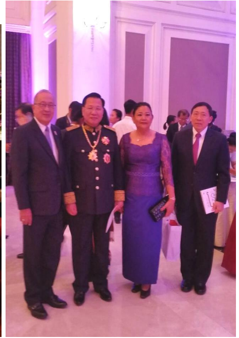
ภาพ : ถ่ายภาพร่วมกับประธานกลุ่มมิตรภาพฯ กัมพูชา – ไทย