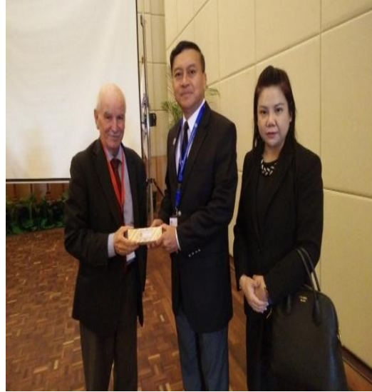
พลเอก นิพัทธ์ ทองเล็ก ผู้แทนฯ มอบของที่ระลึกแก่นายเมียน ราชา รับบानी ประธานวุฒิสภาปากีสถาน ประธานการประชุม และผู้แทนจากปาเลสไตน์

ที่ประชุมคณะกรรมการว่าด้วยการเมืองได้พิจารณาร่างข้อมติ จำนวน ๕ ฉบับ ซึ่งจะได้นำเข้าสู่ที่ประชุมสมัชชาใหญ่เพื่อพิจารณารับรอง ประกอบด้วย