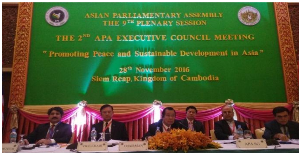
พลเรือเอก อมรเทพ ฅ บางช้าง ทำหน้าที่รองประธานการประชุมคณะมนตรีบริหาร ครั้งที่ ๒