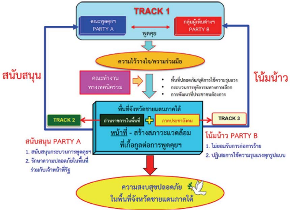
ภาพที่ 1 : กระบวนการพูดคุยเพื่อสันติสุขจังหวัดชายแดนภาคใต้ ที่มา : คณะพูดคุยเพื่อสันติสุขจังหวัดชายแดนภาคใต้ 2560, หน้า 6

การจัดตั้งพื้นที่ปลอดภัย ถือเป็นความก้าวหน้าและเป้าหมายที่สำคัญของการพูดคุยในปี 2560 และได้มีการจัดทำกรอบความร่วมมือในการจัดทำพื้นที่ปลอดภัย โดยมีวัตถุประสงค์ 5 ประการ คือ 1) เพื่อยุติความรุนแรงของทุกฝ่าย 2) เพื่อเป็นมาตรการทดสอบความไว้วางใจร่วมกัน 3) เพื่อให้ประชาชนเข้ามามีส่วนร่วมในการบริหารจัดการพื้นที่ และยกระดับคุณภาพชีวิต 4) เพื่อให้ประชาชนทุกศาสนา สามารถปฏิบัติศาสนกิจได้อย่างเสรี และปลอดภัย และ 5) เพื่อเป็นพื้นที่ต้นแบบในการแก้ไขปัญหาภัยแทรกซ้อน ได้แก่ ยาเสพติด คอร์รัปชัน อบายมุข อาชญากรรม และการก่อการร้าย ทั้งนี้เพื่อให้ประชาชนทุกภาคส่วน ทุกกลุ่มอาชีพ ทุกศาสนา สามารถดำเนินชีวิตประจำวันได้อย่างปกติสุข ปลอดภัย ปราศจากการคุกคามใด ๆ ในพื้นที่ดังกล่าว สำหรับการดำเนินงานจะใช้กลไกความร่วมมือในรูปแบบคณะทำงาน และคณะกรรมการร่วม และกำหนดกรอบระยะเวลาการดำเนินงานเป็น 2 ช่วงเวลา คือ การเตรียมพื้นที่ที่จะใช้เวลาประมาณ 4-6 เดือน และการบริหารพื้นที่ให้เกิดความปลอดภัย รวมทั้งการประเมินผลอีกประมาณ 3-6 เดือน สำหรับขั้นตอนการจัดทำพื้นที่ปลอดภัยจะเริ่มด้วยการจัดตั้ง Safe House เพื่อใช้เป็นสถานที่ในการประสานข้อมูลเรื่องการจัดตั้งพื้นที่ปลอดภัยจากผู้ที่มีส่วนได้ส่วนเสีย ต่อมาจะเป็นการเสนอพื้นที่ที่จะจัดตั้งพื้นที่ปลอดภัยให้คณะพูดคุยทั้งสองฝ่ายให้ความเห็นชอบ อย่างน้อย 1 พื้นที่ จากพื้นที่ที่กลุ่มผู้เห็นต่างฯ เสนอ 5 พื้นที่ หลังจากนั้น