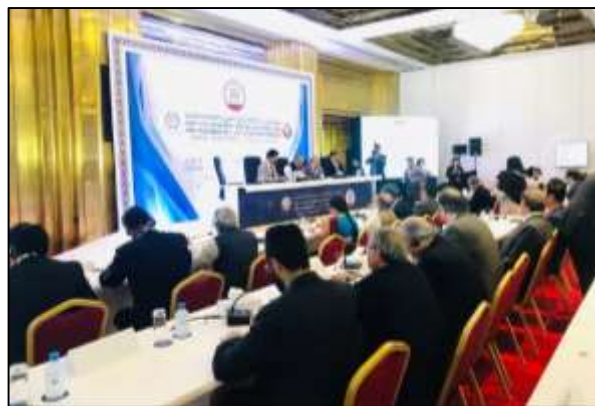
การประชุมกลุ่มภูมิรัฐศาสตร์เอเชีย-แปซิฟิก