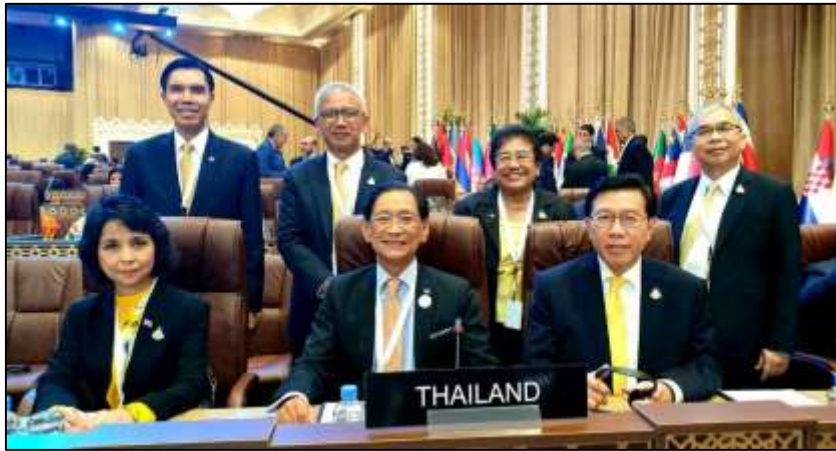
คณะผู้แทนสภานิติบัญญัติแห่งชาติเข้าร่วมการประชุมสมัชชาสหภาพรัฐสภา ครั้งที่ ๑๔๐ ในวันแรก

วันอาทิตย์ที่ ๗ เมษายน ๒๕๖๒ เวลา ๑๑.๓๐ นาฬิกา ณ ห้อง Al Dafna คณะผู้แทนสภานิติบัญญัติแห่งชาติ เข้าร่วมการประชุมสมัชชาสหภาพรัฐสภา ครั้งที่ ๑๔๐ โดยในการประชุมดังกล่าว ที่ประชุมสมัชชาฯ ได้เริ่มการอภิปรายทั่วไป (General Debate) ในหัวข้อ "รัฐสภาในฐานะเวทีส่งเสริมการศึกษาเพื่อสันติภาพ ความมั่นคงและหลักนิติธรรม" (Parliaments as platforms to enhance education for peace, security and the rule of law) เป็นวันแรก โดยในวันนี้จัดสรรเวลาเฉพาะสำหรับการกล่าวถ้อยแถลงของผู้ดำรงตำแหน่งประธานรัฐสภา