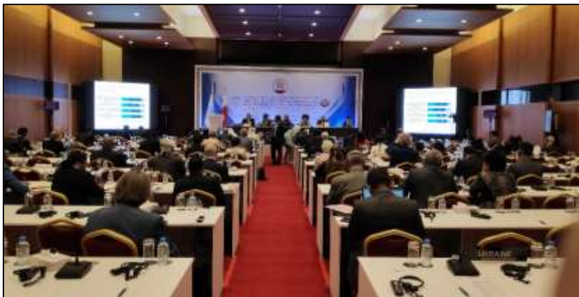
การประชุมคณะกรรมการการสัมมนาว่าด้วยกิจการสหประชาชาติ