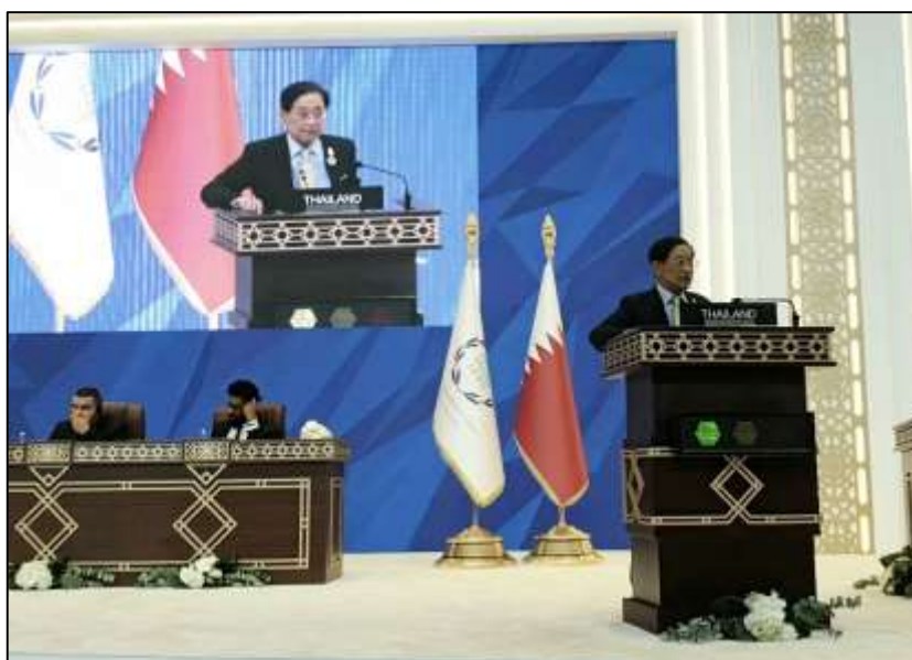
นายกิตติ วะสีนนท์ หัวหน้าคณะผู้แทนสถานิติบัญญัติแห่งชาติ ขณะกล่าวถ้อยแถลงต่อที่ประชุมสมัชชาฯ

ในวันอังคารที่ ๙ เมษายน ๒๕๖๒ คณะผู้แทนสถานิติบัญญัติแห่งชาติ เข้าร่วมการประชุมสมัชชา สหภาพรัฐสภา ครั้งที่ ๑๔๐ เป็นวันที่สาม โดยในโอกาสนี้ นายกิตติ วะสีนนท์ ในฐานะหัวหน้าคณะผู้แทนฯ ได้ขึ้นกล่าวถ้อยแถลงต่อที่ประชุมสมัชชาฯ เมื่อเวลา ๑๒.๑๕ นาฬิกา สรุปใจความสำคัญได้ว่า ขณะนี้ประเทศไทยกำลังเตรียมความพร้อมเนื่องในวโรกาสมหามงคลพระราชพิธีบรมราชาภิเษก อีกทั้งยังได้จัดการเลือกตั้งทั่วไป เมื่อวันที่ ๒๔ มีนาคม ๒๕๖๒ และในฐานะประเทศผู้ดำรงตำแหน่งประธานอาเซียนและประเทศผู้ประสานงานของอาเซียน ในเรื่องการพัฒนาที่ยั่งยืน ประเทศไทยจะใช้โอกาสอันดีนี้ในการเสริมสร้างความร่วมมือในการดำเนินการตามวาระการพัฒนาที่ยั่งยืน ค.ศ. ๒๐๓๐ ของสหประชาชาติ โดยในภาครัฐสภา ประเทศไทยดำรงตำแหน่งประธานสมัชชา รัฐสภาอาเซียน หรือ AIPA และจะเป็นเจ้าภาพจัดการประชุมในกรอบ AIPA รวม ๓ การประชุมในปีอีกด้วย