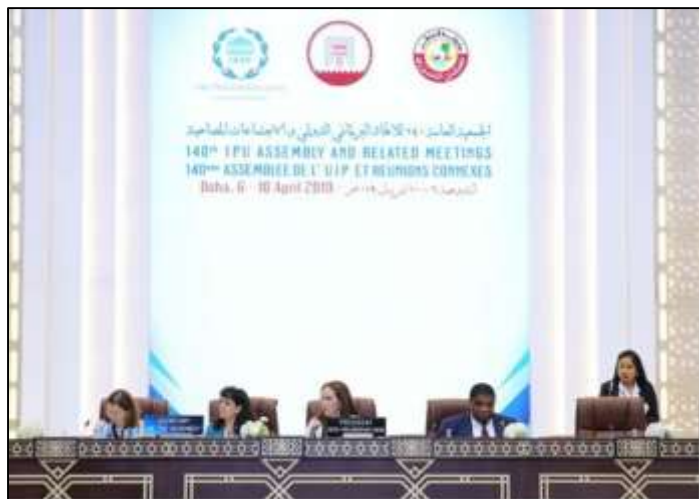
ประธานสหภาพรัฐสภาและเลขาธิการสหภาพรัฐสภา ในช่วงท้ายของการประชุมสมัชชาสหภาพรัฐสภา ครั้งที่ ๑๔๐

ในวันพุธที่ ๑๐ เมษายน ๒๕๖๒ เวลา ๑๗.๐๐ นาฬิกา ที่ประชุมได้ดำเนินเข้าสู่วาระการประชุมสมัชชาสหภาพรัฐสภา ครั้งที่ ๑๔๐ ในช่วงสุดท้าย โดยที่ประชุมได้ร่วมกันรับรองแถลงการณ์โดฮา (Doha Declaration) ซึ่งเป็นเอกสารผลลัพธ์ของการอภิปรายทั่วไปในการประชุมสมัชชาฯ ในช่วง ๓ วันที่ผ่านมา รวมถึงรับรองข้อมติ จำนวน ๒ ข้อมติที่เสนอโดยคณะกรรมการสิทธิการอนามัยว่าด้วยสันติภาพและความมั่นคงระหว่างประเทศ และคณะกรรมการสิทธิการอนามัยว่าด้วยการพัฒนาที่ยั่งยืน การคลังและการค้า ตลอดจนรับทราบรายงานจากคณะกรรมการสิทธิการอนามัยว่าด้วยประชาธิปไตยและสิทธิมนุษยชน และคณะกรรมการสิทธิการอนามัยสหภาพรัฐสภาว่าด้วยกิจการสหประชาชาติ โดยในตอนท้าย ที่ประชุมได้รับทราบการเตรียมการเป็นเจ้าภาพจัดการประชุมสมัชชาสหภาพรัฐสภา ครั้งที่ ๑๔๑ โดยรัฐสภาเซอร์เบีย ณ กรุงเบลเกรด ระหว่างวันที่ ๑๓-๑๗ ตุลาคม ๒๕๖๒