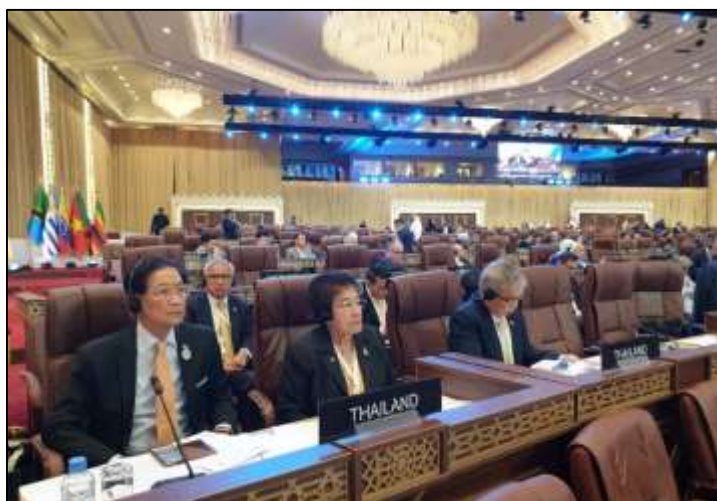
คณะผู้แทนสถานิติบัญญัติแห่งชาติ เข้าร่วมการประชุมคณะมนตรีบริหารสหภาพรัฐสภา ครั้งที่ ๒๐๔