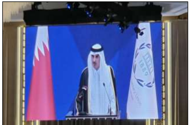
Sheikh Tamim Bin Hamad Al Thani เจ้าผู้ครองรัฐกาตาร์ มีพระราชดำรัสแก่ผู้เข้าร่วมพิธีเปิดการประชุมสมัชชาสหภาพรัฐสภา ครั้งที่ ๑๔๐