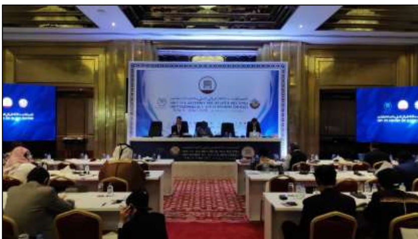
การประชุมคณะกรรมการสามัญสหภาพรัฐสภาว่าด้วยประชาธิปไตยและสิทธิมนุษยชน