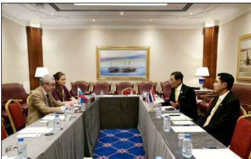
คณะผู้แทนสภานิติบัญญัติแห่งชาติ เข้าพบปะหารือทวิภาคีกับคณะผู้แทนรัฐสภารัสเซีย

โอกาสนี้ ทั้งสองฝ่ายได้หารือแลกเปลี่ยนในประเด็นความสัมพันธ์ทางการทูตของไทย-รัสเซียที่ดำเนินมาอย่างยาวนานกว่า ๑๒๐ ปี โดยรัสเซียถือเป็นมหามิตรของไทย ตั้งแต่รัชสมัยพระบาทสมเด็จพระจุลจอมเกล้าเจ้าอยู่หัว และพระเจ้าซาร์นิโคลัสที่ ๒ แห่งรัสเซีย จากนั้น หัวหน้าคณะผู้แทนฯ ได้แจ้งให้ฝ่ายรัสเซียได้รับทราบถึงการจัดการเลือกตั้งทั่วไปของไทยที่เสร็จสิ้นเมื่อวันที่ ๒๔ มีนาคม ๒๕๖๒ และหลังจากคณะกรรมการการเลือกตั้งได้ประกาศรับรองผลการเลือกตั้งอย่างเป็นทางการภายในวันที่ ๙ พฤษภาคม ๒๕๖๒ แล้ว จะต้องมีรัฐสภาชุดใหม่และจัดตั้งรัฐบาลต่อไป