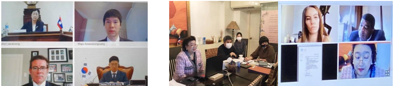
Virtual meetings via teleconferencing, the Third Meeting of the Preparatory Committee for the Fifth World Conference of Speakers of Parliament (5WCSP) (Left) and the COVID-19 Virtual Meeting of the Asia-Pacific Parliamentarian Forum on Global Health (APPFHG). (Right)