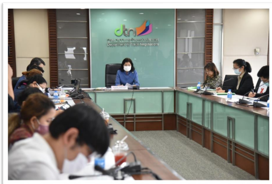
กระทรวงพาณิชย์กับการพิจารณาประเด็นการเข้าร่วมเป็นสมาชิก CPTPP ของไทย