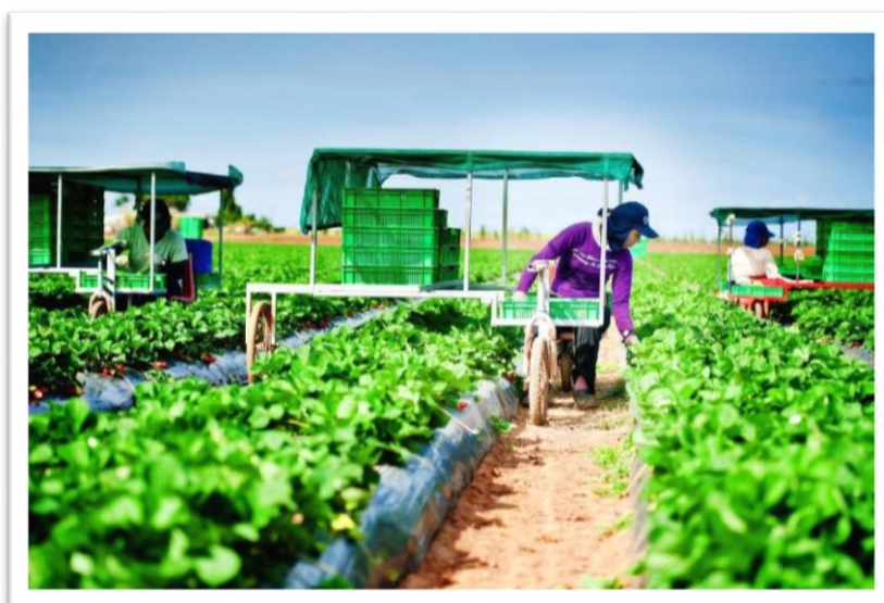
CPTPP อาจส่งผลกระทบต่อภาคเกษตรกรรมของไทย

CPTPP ใช้เงื่อนไขการเจรจาแบบ negative list หรือการระบุนายการที่ไม่เปิดเสรี กล่าวคือ ประเทศสมาชิกสามารถระบุนายการธุรกิจบริการที่ไม่ต้องการเปิดเสรีได้ ส่วนหมวดธุรกิจบริการอื่น ที่ไม่ได้เลือกไว้ในข้อตกลงจะต้องเปิดเสรีต่อนักลงทุนต่างชาติทั้งหมด ดังนั้น สำหรับประเทศไทยที่เป็นประเทศที่ค่อนข้างปิดในหมวดบริการ การเปิดเสรีนี้อาจทำให้ธุรกิจบริการภายในประเทศเสียประโยชน์ให้กับนักลงทุนต่างชาติไป