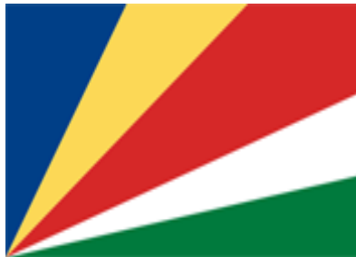
ภาพที่ 1 ธงชาติเซเชลส์

ประเทศเซเชลส์ เป็นประเทศหมู่เกาะในมหาสมุทรอินเดียอยู่ห่างจากฝั่งตะวันออกของประเทศเคนยา ประมาณ 1,800 กิโลเมตร ห่างจากด้านตะวันตกเฉียงใต้ของเมืองบอมเบย์ ประเทศอินเดีย ประมาณ 3,300 กิโลเมตร และอยู่ทางด้านตะวันออกเฉียงเหนือของเกาะมาดากัสการ์ ประมาณ 1,100 กิโลเมตร ถูกจัดอยู่ในภูมิภาคแอฟริกา มีพื้นที่ 455 ล้านตารางกิโลเมตร (กระทรวงการต่างประเทศ, 2563) ประกอบด้วยเกาะประมาณ 115 เกาะ เกาะใหญ่ที่สุด คือ เกาะ Mahe มีพื้นที่ประมาณ 148 ตารางกิโลเมตร นอกนั้นมีเกาะ Praslin เกาะ La Dique เป็นต้น โดยมี “กรูวิกตอเรีย” (Victoria City) เป็นเมืองหลวง (สาธารณรัฐเซเชลส์, 2562) ปัจจุบันมีจำนวนประชากรประมาณ 99,120 คน (ข้อมูล ณ วันที่ 4 ตุลาคม 2564) (“Seychelles Population (LIVE),” 2021) ใช้ภาษาอังกฤษ ภาษาฝรั่งเศส เป็นภาษาราชการ และภาษาครีโอล (Creole) เป็นภาษาท้องถิ่น นับถือศาสนาคริสต์ (นิกายโรมันคาทอลิก ร้อยละ 82.3 และนิกายแองกลิคัน ร้อยละ 6.4 นิกายอื่น ๆ ร้อยละ 4.5) ศาสนาฮินดู ร้อยละ 2.1 ศาสนาอิสลาม ร้อยละ 2.1 และอื่น ๆ ร้อยละ 2.6 (สาธารณรัฐเซเชลส์, 2562)