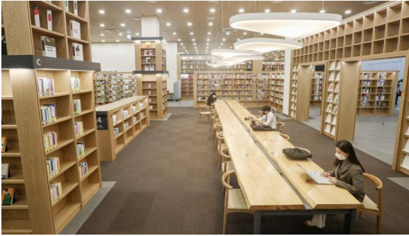
ภาพห้องอ่านหนังสือทั่วไป