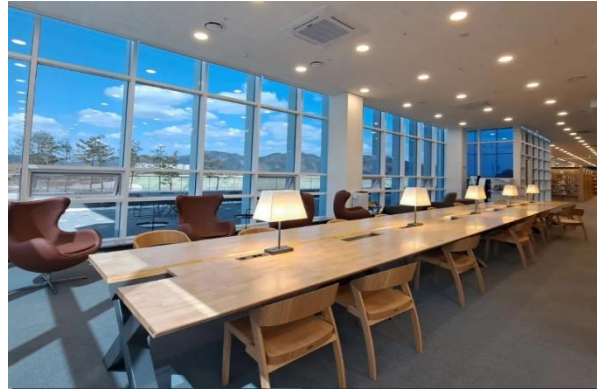
ภาพพื้นที่ใช้สอยบริเวณ ชั้น ๑ สามารถมองเห็นวิวทิวทัศน์ภายนอกได้

ภายในอาคารหอสมุดรัฐสภาประกอบไปด้วยห้องเก็บหนังสือทั่วไป ห้องอ่านหนังสือสำหรับเด็ก ห้องประชุม ห้องสัมมนา พื้นที่อ่านหนังสือ และห้องจัดแสดงนิทรรศการ นิทรรศการฉลองครบรอบ ๗๐ ปี ของการเปิดหอสมุดรัฐสภา และนิทรรศการอื่น ๆ โดยตั้งแต่วันที่ ๑๖.๐๐ เป็นต้นไปของวันที่ ๓๑ มีนาคม ถึงวันที่ ๑ เมษายน ๒๕๖๕ ระหว่างเวลา ๑๖.๐๐ - ๑๘.๐๐ มีจัดกิจกรรมแสตมป์ทัวร์ (Stamp Tour) เพื่อฉลองการเปิดหอสมุดรัฐสภาประจำมหานครปูซาน