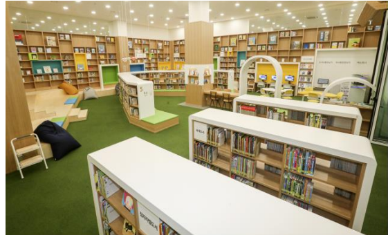
ภาพห้องอ่านหนังสือสำหรับเด็ก

หอสมุดแห่งนี้มีหนังสือที่ขนย้ายมาจากหอสมุดรัฐสภากรุงโซล จำนวน ๑.๗๕ ล้านเล่ม (หอสมุดรัฐสภากรุงโซล มีหนังสือ ๗.๓ ล้านเล่ม) และคาดว่าจะมีหนังสือใหม่เพิ่มขึ้นต่อปีจำนวน ๒.๗ หมื่นเล่ม โดยประชาชนสามารถยืมหนังสือได้ ๕ รายการ มีกำหนด ๑๕ วัน