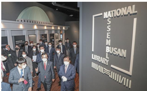
ภาพประธานรัฐสภาและผู้เกี่ยวข้องเยี่ยมชมหอสมุดรัฐสภา