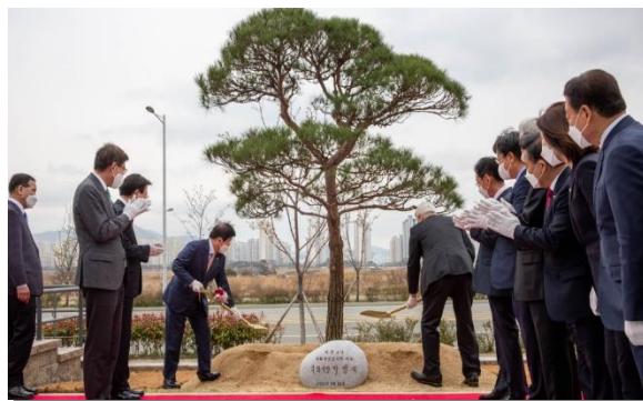
ภาพประธานรัฐสภาปลูกต้นไม้บริเวณอาคารหอสมุดรัฐสภา

นายปัก บยองซอก ประธานรัฐสภาฯ ได้กล่าวเปิดงานมีข้อความตอนหนึ่งว่า “ปูซานถือเป็นรากฐานของห้องสมุด เพราะห้องสมุดชั่วคราวของรัฐสภาเคยถูกสร้างขึ้นในเมืองปูซานและบัดนี้ได้กลับมายังประชาชนชาวปูซานอีกครั้ง จึงหวังว่าการให้บริการข้อมูลทางวิชาการและความรู้ทางการเมืองที่สั่งสมมาตลอดระยะเวลา ๗๐ ปี จะได้สร้างภูมิปัญญาแห่งประชาธิปไตยในระบอบรัฐสภาของเกาหลีให้เจริญก้าวหน้าต่อไป”