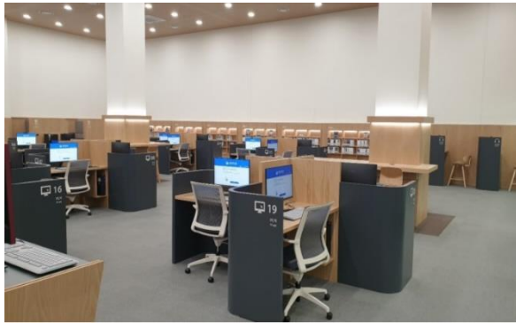
ภาพห้องมัลติมีเดีย หนังสือเสียง (Audiobook)

ภายในอาคารหอสมุดรัฐสภาประกอบไปด้วยห้องเก็บหนังสือทั่วไป ห้องอ่านหนังสือสำหรับเด็ก ห้องประชุม ห้องสัมมนา พื้นที่อ่านหนังสือ และห้องจัดแสดงนิทรรศการ นิทรรศการฉลองครบรอบ ๗๐ ปี ของการเปิดหอสมุดรัฐสภา และนิทรรศการอื่น ๆ โดยตั้งแต่วันที่ ๑๖.๐๐ เป็นต้นไปของวันที่ ๓๑ มีนาคม ถึงวันที่ ๑ เมษายน ๒๕๖๕ ระหว่างเวลา ๑๖.๐๐ - ๑๘.๐๐ มีจัดกิจกรรมแสตมป์ทัวร์ (Stamp Tour) เพื่อฉลองการเปิดหอสมุดรัฐสภาประจำมหานครปูซาน