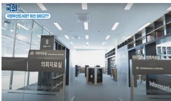
ภาพห้องเก็บข้อมูลกฎหมายและเอกสารวิชาการรัฐสภาชั้น ๒

อาคารหอสมุดแห่งนี้เริ่มก่อสร้างเมื่อปี ๒๕๕๗ สร้างเสร็จเมื่อเดือนมิถุนายน ๒๕๖๔ ด้วยงบประมาณ ๔.๒๗ หมื่นล้านบาท (ประมาณ ๑.๒๘ พันล้านบาท) เป็นอาคาร ๓ ชั้น มีพื้นที่ใช้สอย ๑๓,๖๖๑ ตร.ม. สำหรับใช้เป็นห้องสมุดสาธารณะเป็นแหล่งเรียนรู้ข้อมูลวิชาการของรัฐสภา และกฎหมายเพื่อส่งเสริมความรู้ในระบอบประชาธิปไตย