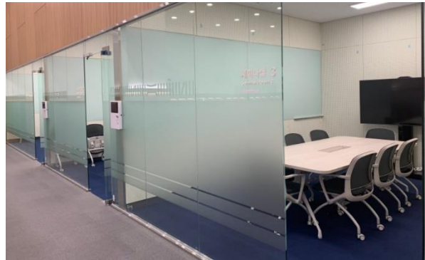
ภาพห้องประชุมขนาดเล็กให้บริการครึ่งละ ๓ ชั่วโมง

ตั้งแต่วันที่ ๒ เมษายน ๒๕๖๕ เริ่มเปิดให้ประชาชนทั่วไปสามารถทำบัตรสมาชิกหอสมุด ให้บริการยืมหนังสือ และสามารถจองห้องสัมมนาได้ โดยเวลาเปิดให้บริการหอสมุด วันธรรมดา ตั้งแต่เวลา ๐๙.๐๐ - ๒๑.๐๐ น. วันเสาร์ - อาทิตย์ ตั้งแต่เวลา ๐๙.๐๐ - ๑๗.๐๐ น. ทั้งนี้จะปิดให้บริการทุกวันอังคารและวันหยุดนักขัตฤกษ์ หอสมุดแห่งนี้จึงถือเป็นอีกหนึ่งสถานที่แหล่งเรียนรู้แห่งใหม่ที่สามารถดึงดูดความสนใจของประชาชนในพื้นที่ได้เข้ามาใช้บริการได้อย่างสะดวก