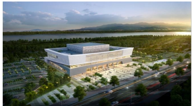
ภาพนายปึก บอยงชอก ประธานรัฐสภาและผู้เกี่ยวข้องเข้าร่วมพิธีเปิดอาคารหอสมุดรัฐสภาประจำมหานครปูซาน เมื่อวันที่ ๓๑ มีนาคม ๒๕๖๕