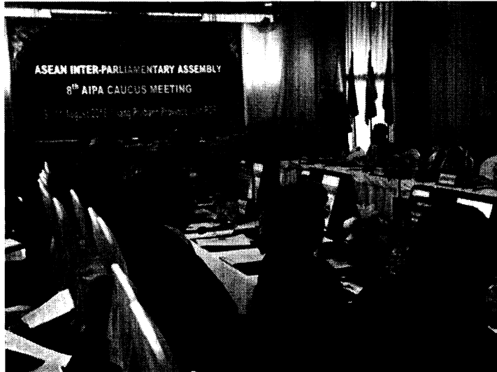
ภาพบรรยากาศห้องประชุม การประชุมเต็มคณะ ช่วงที่ ๑ และ ๒