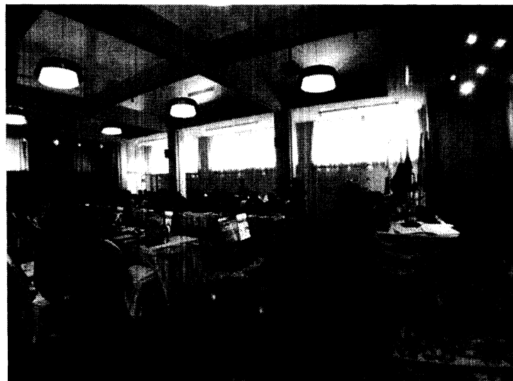
ภาพบรรยากาศห้องประชุม การประชุม AIPA Caucus ครั้งที่ ๘