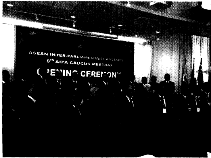
คณะผู้แทนรัฐสภาสมาชิก AIPA ถ่ายภาพเป็นที่ระลึกในพิธีเปิดการประชุม AIPA Caucus ครั้งที่ ๘