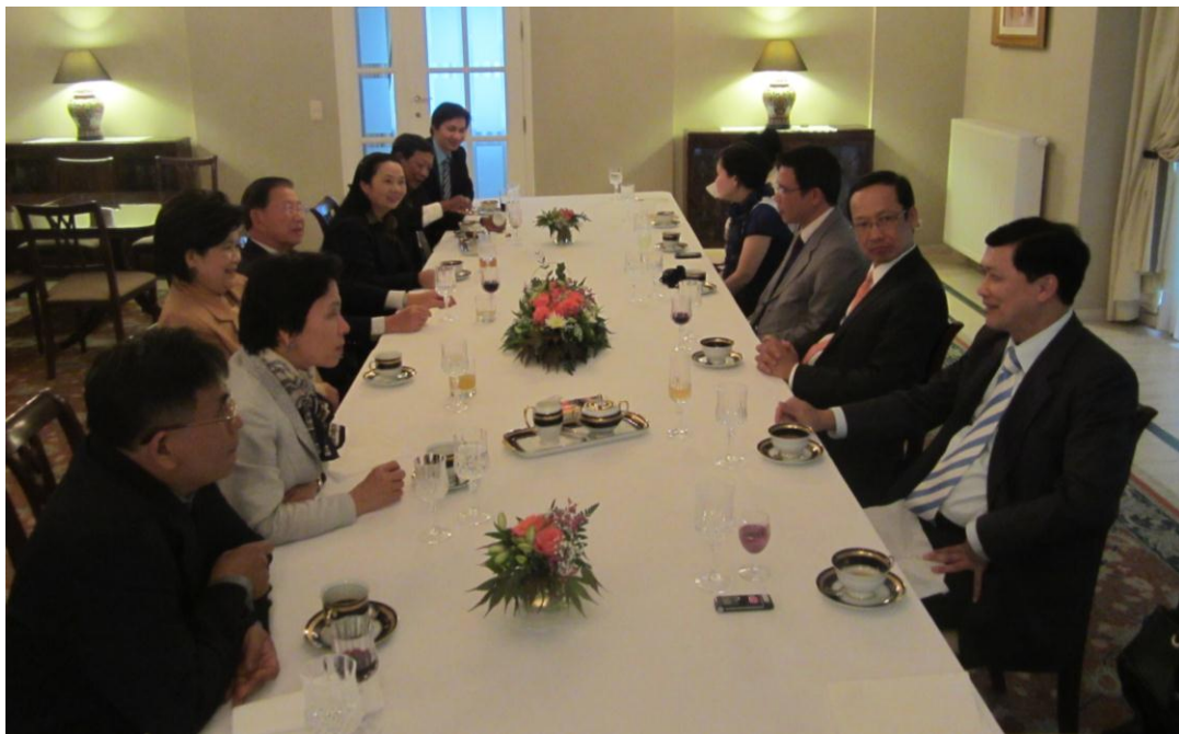
งานเลี้ยงรับรองอาหารค่ำแก่คณะผู้แทนกลุ่มมิตรภาพฯ ไทย-เบลเยียม ณ ทำเนียบเอกอัครราชทูตฯ