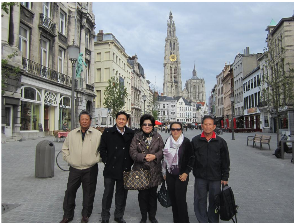
คณะเยี่ยมชมจัตุรัสกลางเมืองอันท์เวิร์ป