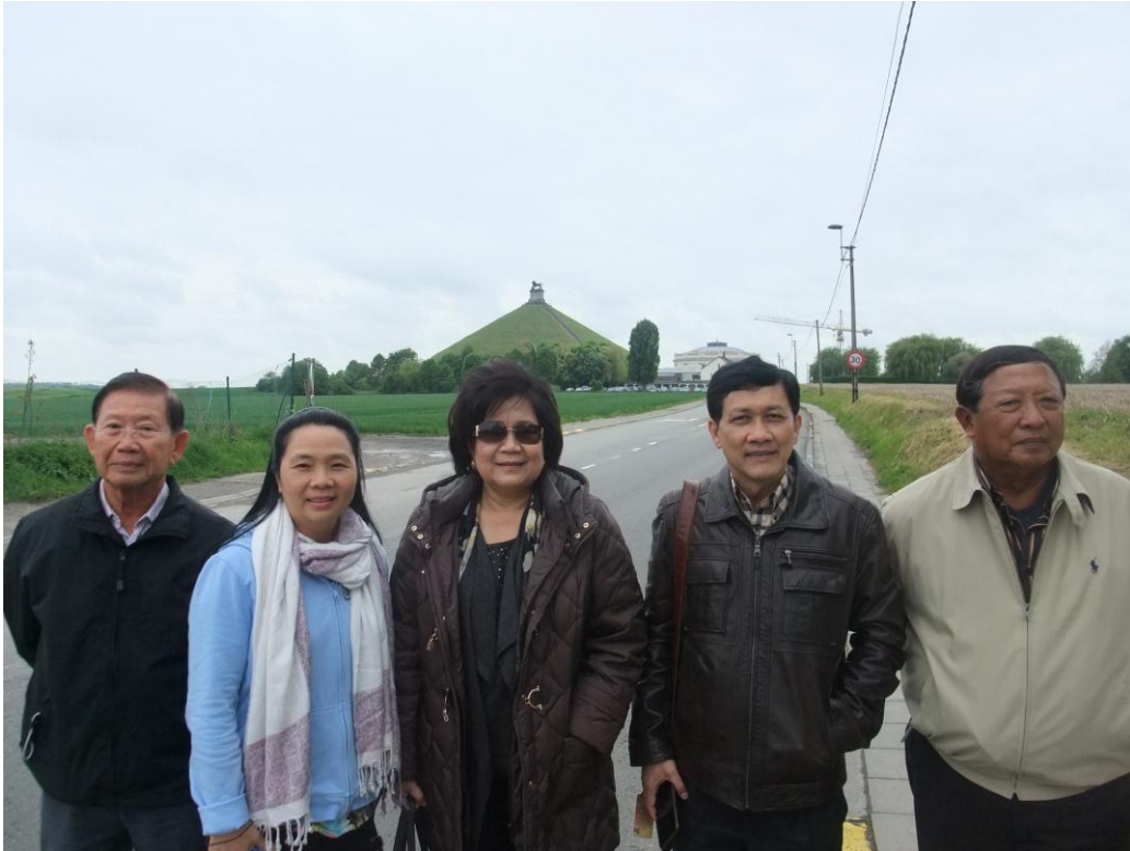
คณะถ่ายภาพบริเวณอนุสาวรีย์วอเตอร์ลู