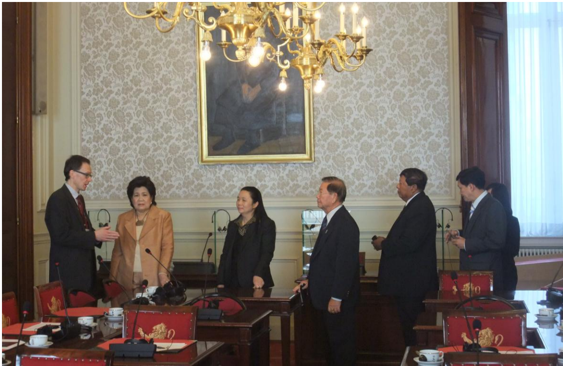
คณะผู้แทนฯ เยี่ยมชมห้องประชุมคณะกรรมการธิการ