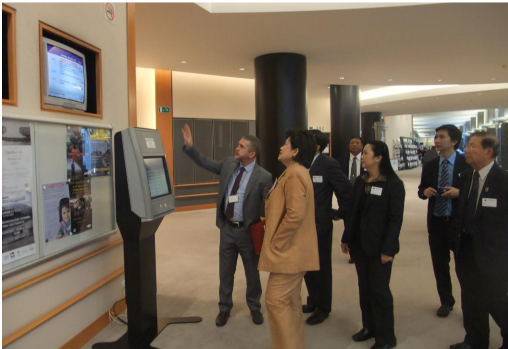
คณะเยี่ยมชมรัฐสภายุโรป