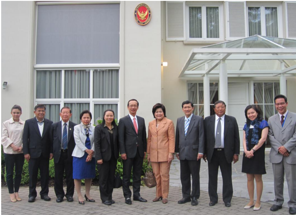
คณะถ่ายภาพร่วมกับเจ้าหน้าที่สถานเอกอัครราชทูต ณ กรุงบรัสเซลส์