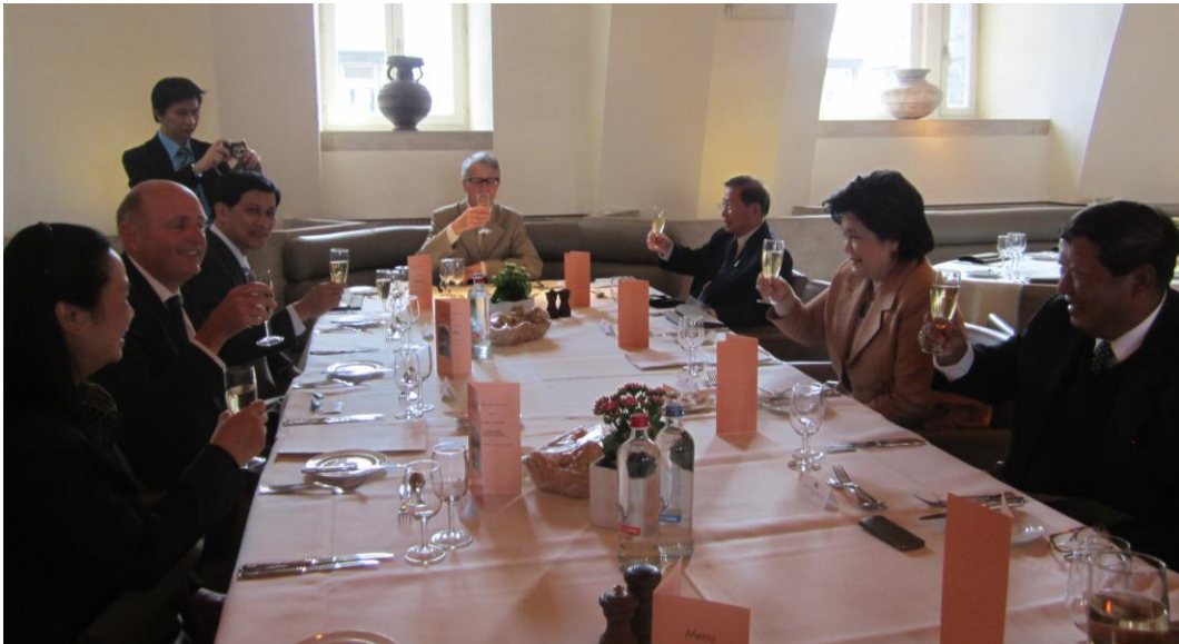
กลุ่มมิตรภาพฯ เบลเยียม-ไทยเป็นเจ้าภาพเลี้ยงรับรองอาหารกลางวันแก่คณะ

๒.๑ งานเลี้ยงรับรองอาหารกลางวันเพื่อเป็นเกียรติแก่คณะฯ โดยนาย Georges Dallemagne สมาชิกสภาผู้แทนราษฎรและสมาชิกกลุ่มมิตรภาพฯ เบลเยียม-ไทย เป็นเจ้าภาพ ในวันอังคารที่ ๒๘ พฤษภาคม พ.ศ. ๒๕๕๖ เวลา ๑๒.๓๐ นาฬิกา ณ ห้องอาหารอาคารรัฐสภา