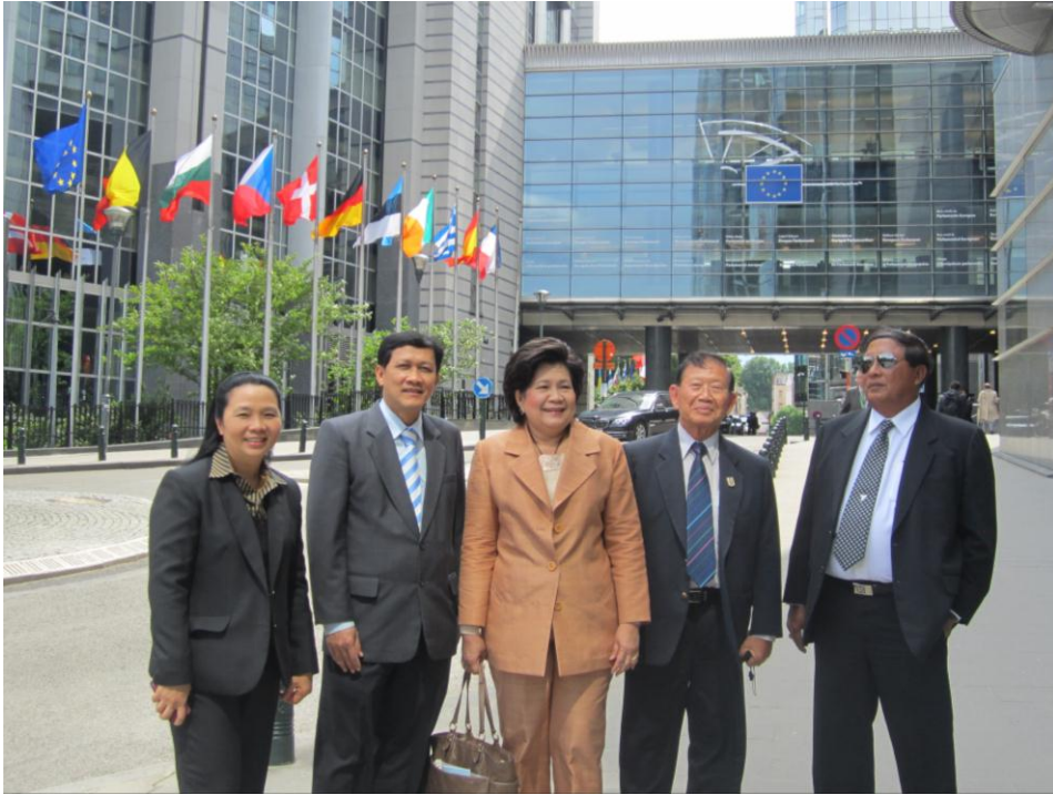
คณะถ่ายภาพด้านนอกอาคารรัฐสภายุโรป