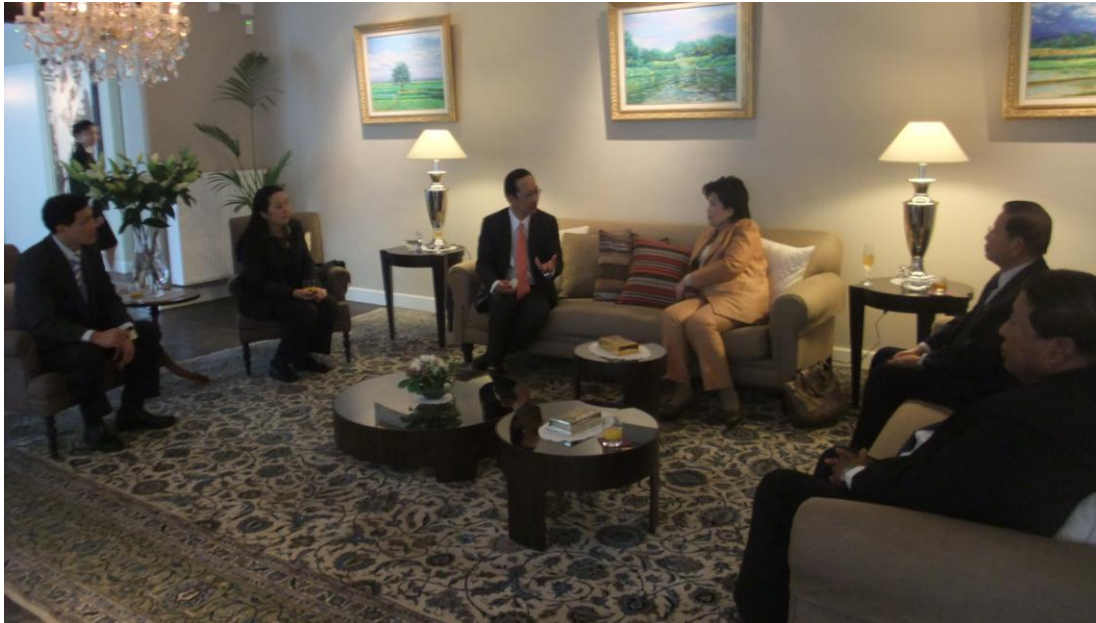
คณะเข้าเยี่ยมคารวะเอกอัครราชทูตฯ

๒.๒ งานเลี้ยงรับรองอาหารค่ำเพื่อเป็นเกียรติแก่คณะฯ โดยนายอภิชาติ ชินวรรณโณ เอกอัครราชทูต ณ กรุงบรัสเซลส์ เป็นเจ้าภาพ ในวันอังคารที่ ๒๘ พฤษภาคม พ.ศ. ๒๕๕๖ เวลา ๑๘.๓๐ นาฬิกา ณ ทำเนียบเอกอัครราชทูตฯ