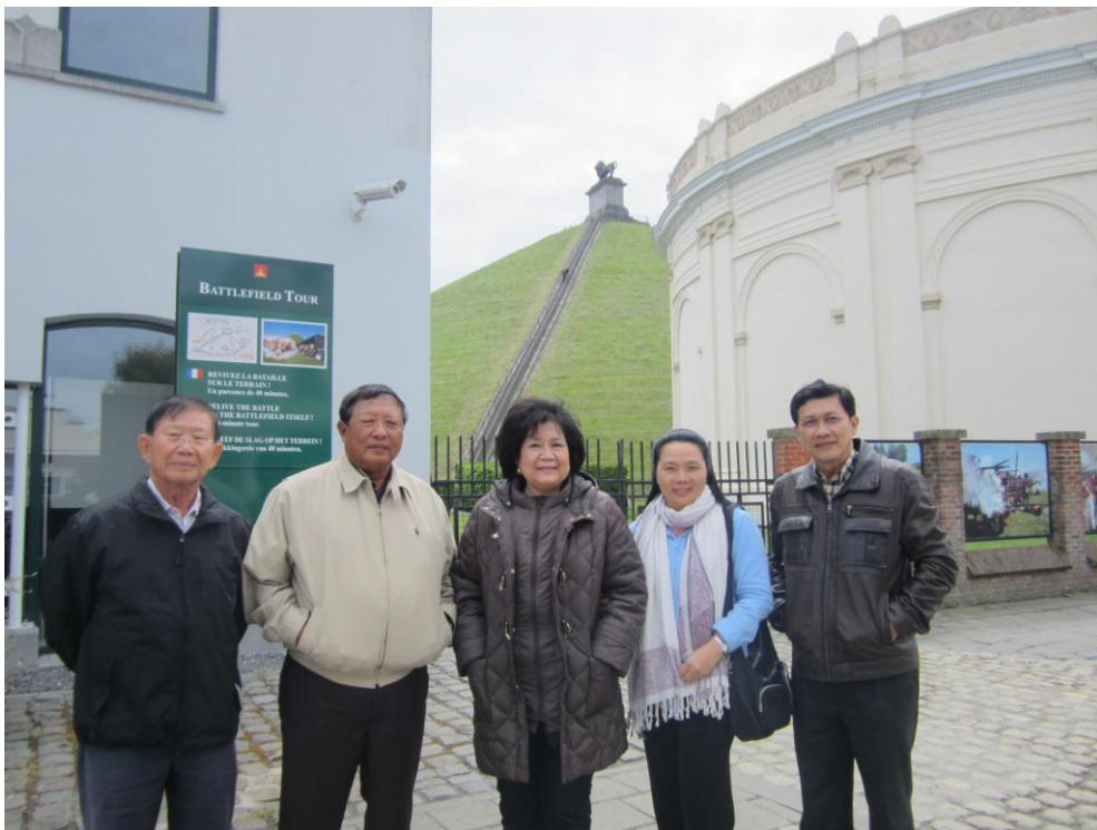
คณะถ่ายภาพบริเวณพิพิธภัณฑ์วอเตอร์ลู