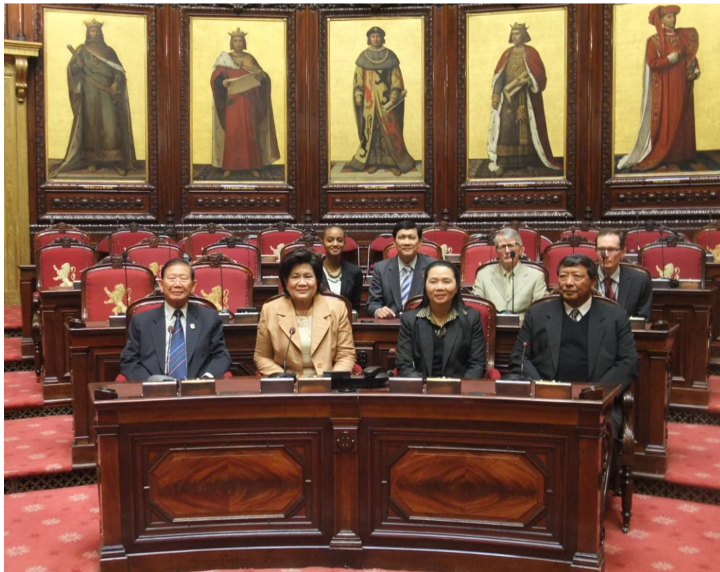
คณะเยี่ยมชมห้องประชุมสภาผู้แทนราษฎร