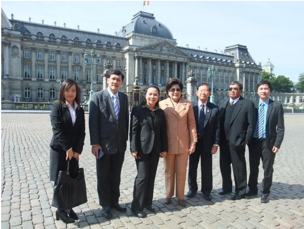
คณะผู้แทนฯ ถ่ายภาพด้านหน้าพระราชวัง