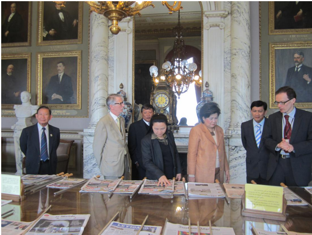
คณะเยี่ยมชมห้องอ่านหนังสือสมาชิกสภาผู้แทนราษฎร