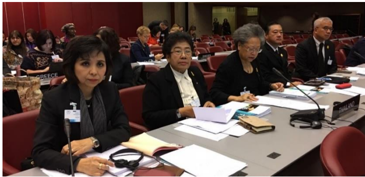
คณะผู้แทนสภานิติบัญญัติแห่งชาติ นำโดย นางพิไลพรรณ สมบัติศิริ ประธานคณะกรรมการการต่างประเทศ สภานิติบัญญัติแห่งชาติ เข้าร่วมการประชุมสหภาพรัฐสภาสตรี ครั้งที่ ๒๔

สมาชิกสภานิติบัญญัติแห่งชาติ และกรรมการในคณะกรรมการสหภาพรัฐสภาสตรี ได้ร่วมอภิปรายต่อร่างข้อมติ เรื่อง "เสรีภาพของสตรีและการมีส่วนร่วมในกระบวนการทางการเมืองอย่างเต็มที่ ปลอดภัย และปราศจากการแทรกแซง : การสร้างความเป็นหุ้นส่วนระหว่างชายและหญิงในการบรรลุวัตถุประสงค์นี้" (The freedom of women to participate in political process fully, safely and without interference: Building partnerships between men and women to achieve this objective) โดยกล่าวว่า ร่างรัฐธรรมนูญของไทยที่ผ่านประชามติ เมื่อเดือนสิงหาคม ๒๕๕๙ นั้นมีบทบัญญัติที่รับรองเรื่องความเท่าเทียมทางเพศ รวมทั้งมีมาตรการคุ้มครองดูแลผู้หญิง เด็ก คนพิการ และผู้ด้อยโอกาส นอกจากนี้ ประเทศไทยได้ออกพระราชบัญญัติความเท่าเทียมระหว่างเพศ พ.ศ. ๒๕๕๘ เพื่อใช้เป็นกลไกในการแก้ปัญหาให้กับผู้ที่ได้รับผลกระทบจากการเลือกปฏิบัติ