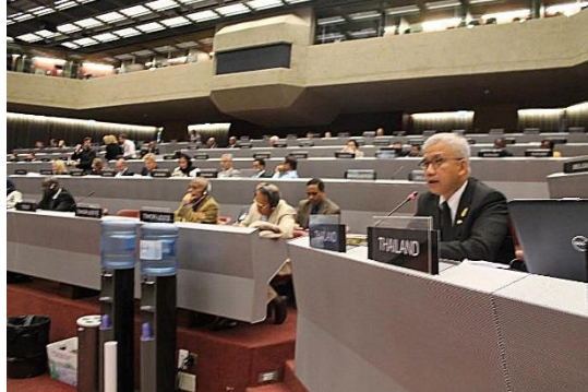
นายอนุศาสน์ สุวรรณมงคล ผู้แทนสถานิติบัญญัติแห่งชาติ เข้าร่วมประชุมคณะกรรมการการสามัญสหภาพรัฐสภาว่าด้วยสันติภาพและความมั่นคงระหว่างประเทศ และร่วมอภิปรายในหัวข้อ "Promoting democratic accountability of the private security sector"

ข้อผิดพลาดและรับประกันความมั่นคงทางการเมือง ความเท่าเทียมในสังคมและการเคารพต่อสิทธิมนุษยชน อย่างไรก็ตาม การเข้าไปสร้างศักยภาพให้กับรัฐใดจะต้องอยู่บนพื้นฐานที่สร้างสรรค์และการได้รับความยินยอมจากรัฐนั้น ๆ