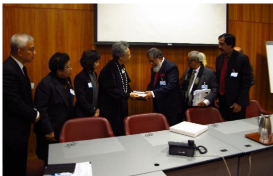
นางพิไลพรรณ สมบัติศิริ ประธานคณะกรรมการการต่างประเทศ สภานิติบัญญัติแห่งชาติ และหัวหน้าคณะผู้แทนสภานิติบัญญัติแห่งชาติ พร้อมด้วยคณะผู้แทนสภานิติบัญญัติแห่งชาติ เข้าพบหารือทวิภาคีกับนายรพี ปาซเชิล รองประธานรัฐสภาและหัวหน้าคณะผู้แทนรัฐสภาบังกลาเทศ และคณะ

ในการนี้ หัวหน้าคณะผู้แทนรัฐสภาบังกลาเทศได้ให้ข้อมูลเกี่ยวกับการเตรียมความพร้อมในการเป็นเจ้าภาพจัดการประชุมสมัชชาสหภาพรัฐสภา ครั้งที่ ๑๓๖ และการประชุมอื่น ๆ ที่เกี่ยวข้อง พร้อมทั้งขอให้รัฐสภาทั้งสองประเทศได้มีการแลกเปลี่ยนการเยือนระหว่างกันเพื่อที่ทั้งสองฝ่ายจะได้แลกเปลี่ยนประสบการณ์ และเห็นพัฒนาการในด้านต่าง ๆ โดยเฉพาะด้านเศรษฐกิจซึ่งบังกลาเทศได้เปิดเขตเศรษฐกิจพิเศษกว่า ๑๐๐ แห่ง เพื่อให้นักลงทุนต่างชาติเดินทางมาลงทุนในบังกลาเทศ ซึ่งหัวหน้าคณะผู้แทนสภานิติบัญญัติแห่งชาติเห็นด้วยในการส่งเสริมการลงทุนร่วมกัน และทราบว่าทั้งสองฝ่ายได้มีการหารือโครงการขนส่งทางทะเลท่าระนอง-ท่าเรือจิตตะกองเพื่อเพิ่มมูลค่าการค้าระหว่างกัน นอกจากนี้ หัวหน้าคณะผู้แทนรัฐสภาบังกลาเทศได้ขอสนับสนุนจากฝ่ายไทยในการต่อต้านการการค้ารายด้วย