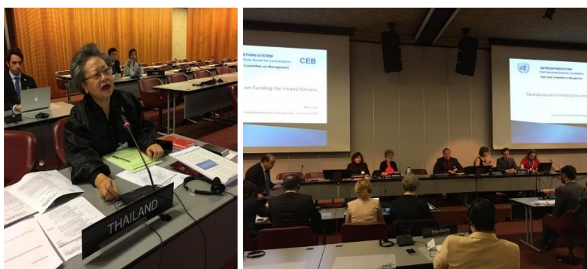
นางพิไลพรรณ สมบัติศิริ ประธานคณะกรรมการการต่างประเทศ สภานิติบัญญัติแห่งชาติ และหัวหน้าคณะผู้แทนสภานิติบัญญัติแห่งชาติ เข้าร่วมการประชุมคณะกรรมการสามัญสหภาพรัฐสภาว่าด้วยกิจการสหประชาชาติ

๖.๔ การประชุมคณะกรรมการสามัญสหภาพรัฐสภาว่าด้วยกิจการสหประชาชาติ เมื่อวันที่ ๒๖ ตุลาคม ๒๕๕๙ เวลา ๐๙.๐๐ - ๑๓.๐๐ นาฬิกา นางพิไลพรรณ สมบัติศิริ ประธานคณะกรรมการการต่างประเทศ สภานิติบัญญัติแห่งชาติ และหัวหน้าคณะผู้แทนสภานิติบัญญัติแห่งชาติ เข้าร่วมการประชุมคณะกรรมการสามัญสหภาพรัฐสภาว่าด้วยกิจการสหประชาชาติ โดยที่ประชุมฯ ได้รับรองนางพิไลพรรณ สมบัติศิริ เป็นสมาชิก Bureau ของคณะกรรมการสามัญสหภาพรัฐสภาว่าด้วยกิจการสหประชาชาติ นอกจากนี้ ที่ประชุมฯ ได้มีการอภิปรายใน ๒ หัวข้อคือ ๑) “การสนับสนุนทางการเงินแก่สหประชาชาติ” (Funding the United Nations) เพื่อรับทราบข้อมูลเงินอุดหนุนของประเทศสมาชิกและกิจกรรมต่าง ๆ ที่สหประชาชาติได้ใช้จ่ายไป โดยเฉพาะอย่างยิ่ง การสนับสนุนทางการเงินขององค์การสหประชาชาติต่อการดำเนินการให้บรรลุผลตามเป้าหมายการพัฒนาที่ยั่งยืน (SDGs) และ ๒) “ท่าทีของสหประชาชาติต่อข้อกล่าวหาว่ามีการล่วงละเมิดทางเพศโดยผู้ปฏิบัติหน้าที่ในการรักษาสันติภาพของสหประชาชาติ” (UN response to allegations of sexual exploitation and sexual abuse by UN Peacekeepers) เพื่อรับฟังการแก้ไขปัญหาจากการที่มีรายงานว่า ทหาร ตำรวจ และเจ้าหน้าที่รักษาสันติภาพในกิจการขององค์การสหประชาชาติได้กระทำการล่วงละเมิดผู้หญิงและเด็ก ซึ่งในแต่ละปีมีการกล่าวหาถึง ๘๐ เรื่องโดยประมาณ จึงจำเป็นต้องมีการปฏิรูปการดำเนินการของสหประชาชาติ เพื่อคุ้มครองผู้เสียหายและให้การเยียวยาอย่างเต็มที่โดยถือนโยบายที่จะไม่อดทนต่อการกระทำดังกล่าวของเจ้าหน้าที่ ทั้งนี้ เมื่อเดือนกุมภาพันธ์ ๒๕๕๙ เลขาธิการสหประชาชาติได้แต่งตั้งผู้ประสานงานพิเศษเพื่อทำหน้าที่ตอบสนองต่อปัญหาในเรื่องนี้