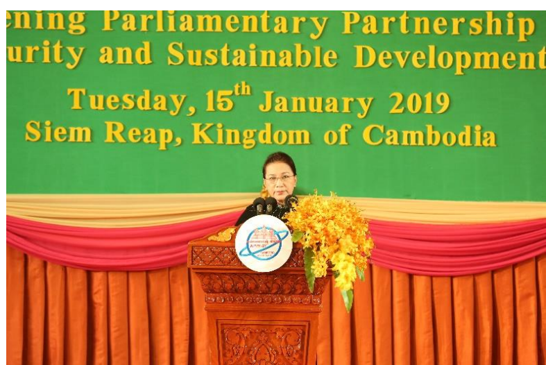
การกล่าวถ้อยแถลงโดยนางเหวียน ถิ กิม เงิน ประธานสภาแห่งชาติเวียดนาม และอดีตประธานการประชุม APPF ครั้งที่ ๒๖