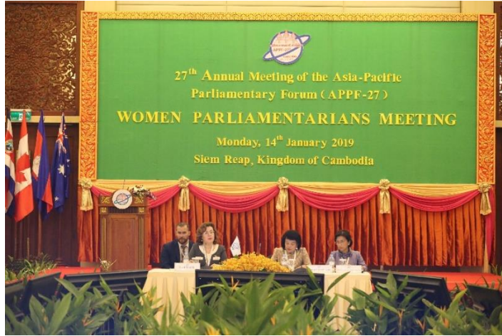
นางควน สุตารี รองประธานสภาแห่งชาติ คนที่สอง และประธานกลุ่มสมาชิกรัฐสภาสตรี ประธานการประชุม