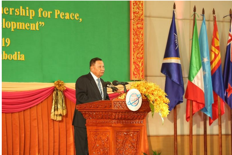
กล่าวปาฐกถา โดย สมเด็จพระวิบูลเสนาภักดิ์ สาย ชุม ประธานวุฒิสภाराชาอาณาจักรกัมพูชา