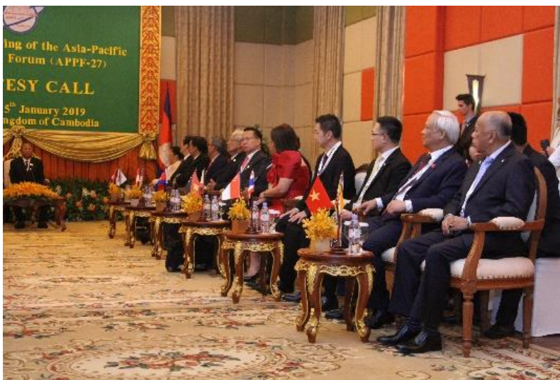
หัวหน้าคณะผู้แทนจากประเทศต่าง ๆ ได้เข้าร่วมเยี่ยมคารวะ และร่วมพบหารือสมเด็จอัครมหาเสนาบดี สัมริน