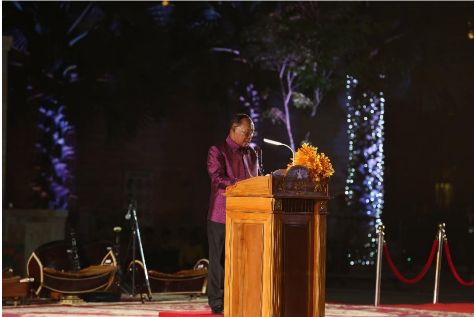
สมเด็จพระเจ้าอัครมหาพญาจักรี เสง สัมริน ประธานสภาแห่งชาติ และประธานการประชุม APPF ครั้งที่ ๒๗ เจ้าภาพงานเลี้ยงอาหารค่ำ

วันจันทร์ที่ ๑๔ มกราคม ๒๕๖๒ เวลา ๑๘.๓๐ – ๒๐.๓๐ นาฬิกา คณะผู้แทนสถานิติบัญญัติแห่งชาติเข้าร่วมงานเลี้ยงอาหารค่ำ โดยสมเด็จพระเจ้าอัครมหาพญาจักรี เสง สัมริน ประธานสภาแห่งชาติ และประธานการประชุม APPF ครั้งที่ ๒๗ พร้อมชมการแสดงทางวัฒนธรรม ณ Poolside, Sokha Siem Reap Resort and Convention Center