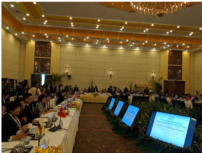
บรรยากาศในการประชุมสมาชิกรัฐสภาสตรี