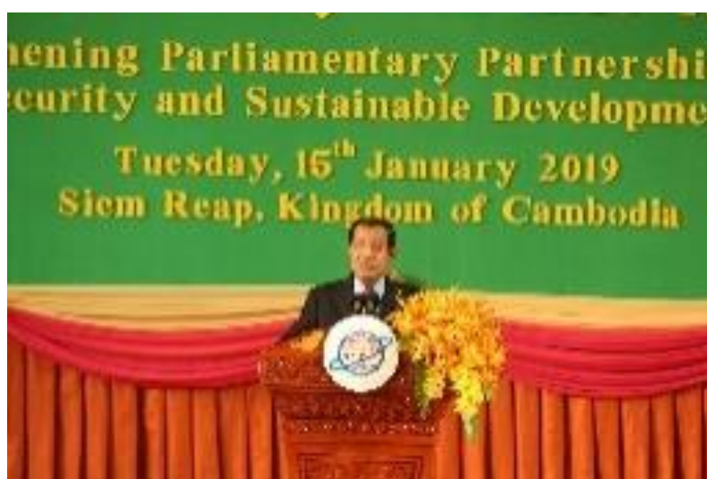
ปาฐกถาพิเศษ โดย สมเด็จพระเจ้าอัครมหาเสนาบดีเดโช ฮุน เซน นายกรัฐมนตรีราชอาณาจักรกัมพูชา