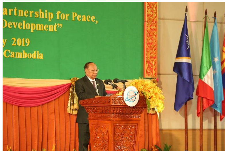
กล่าวเปิดงานโดย สมเด็จพระอัครมหากษัตริย์ เสง สัมริน ประธานสภาแห่งชาติราชาอาณาจักรกัมพูชา และ ประธานการประชุม APPF ครั้งที่ ๒๗