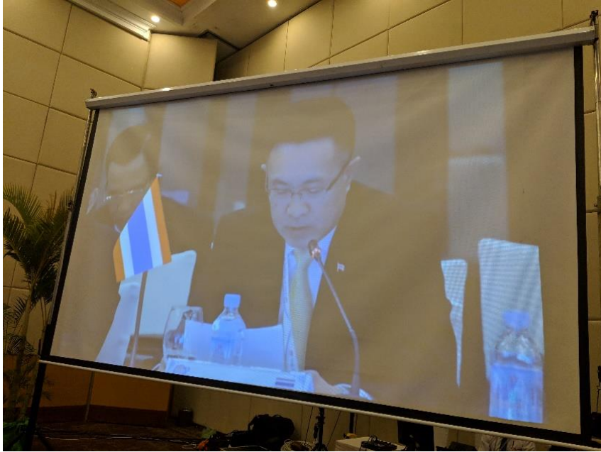
พลเอก สุรพงษ์ สุวรรณอัตถ์ หัวหน้าคณะผู้แทนสถานิติบัญญัติแห่งชาติ กล่าวถ้อยแถลงในหัวข้อการสร้าง ความเชื่อมั่นให้กับสันติภาพ ความมั่นคง และการพัฒนาอย่างยั่งยืนในภูมิภาค