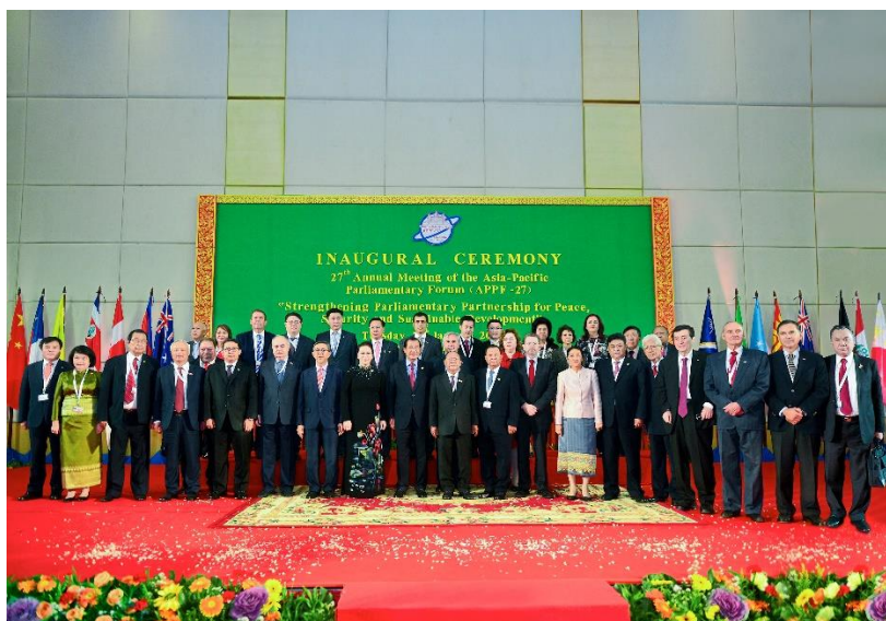
การถ่ายภาพหมู่ในพิธีเปิด