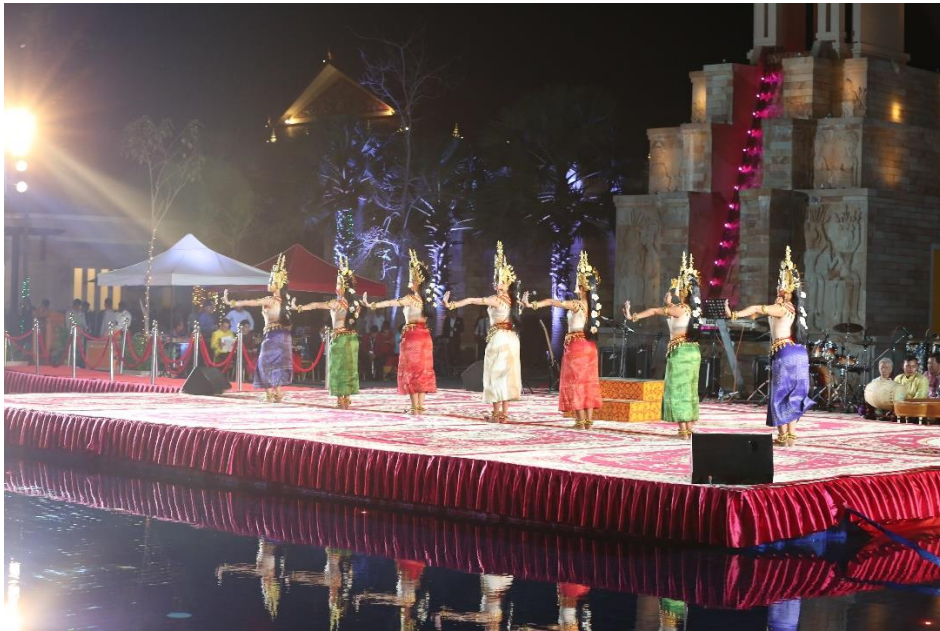
การแสดงทางวัฒนธรรม ณ Poolside