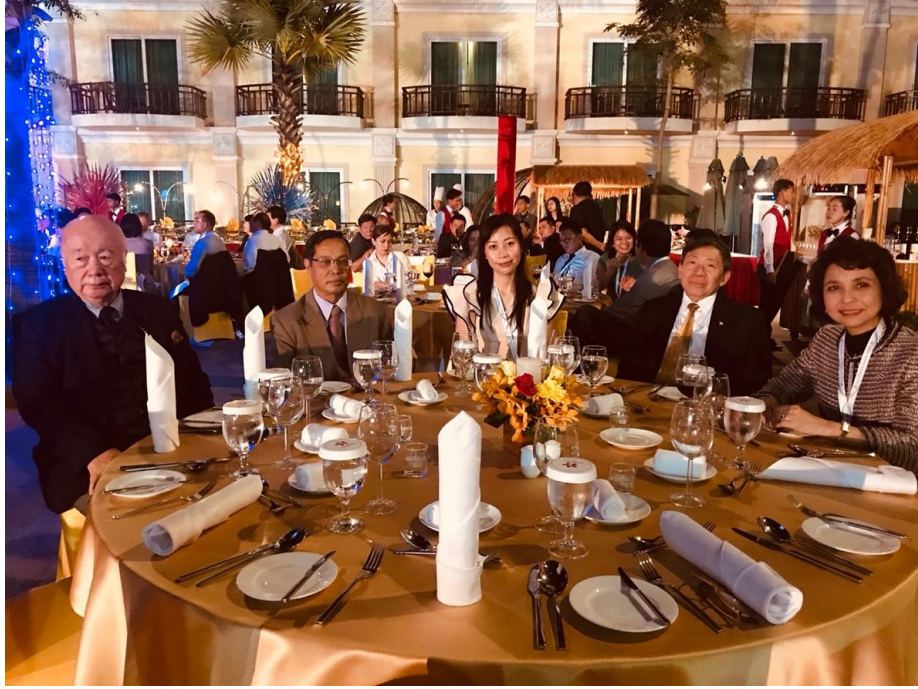
งานเลี้ยงอาหารค่ำ โดยสมเด็จพระเจ้าบรมวงศ์เธอ เจ้าฟ้ากัญจวีร์ เฮง สัมริน ประธานสภาแห่งชาติ และประธาน การประชุม APPF ครั้งที่ ๒๗