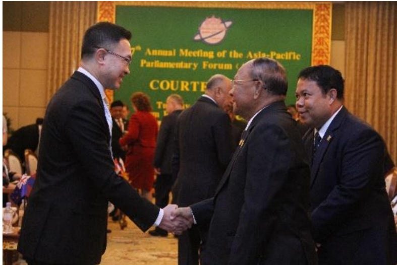
พลเอก สุรพงษ์ สุวรรณอัตถ์ หัวหน้าคณะผู้แทนฯ ได้เข้าเยี่ยมคารวะสมเด็จอัครมหาเสนาบดี สัมริน