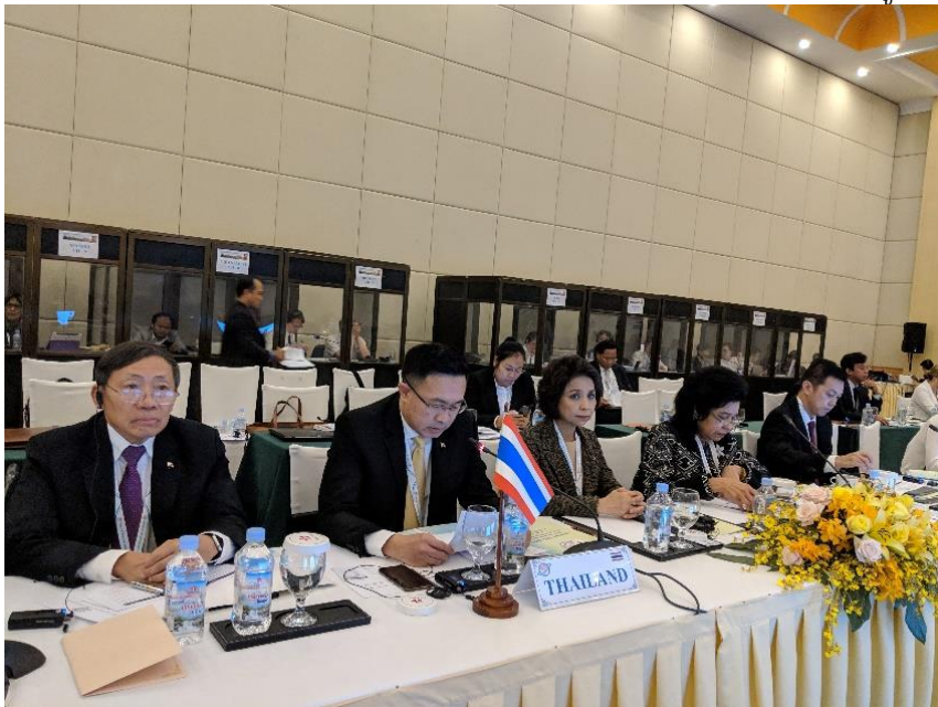
พลเอก สุรพงษ์ สุวรรณอัตถ์ หัวหน้าคณะผู้แทนสถานิติบัญญัติแห่งชาติกล่าวถ้อยแถลงในหัวข้อความร่วมมือ ด้านรัฐสภาที่เข้มแข็งเพื่อสนับสนุนความรับผิดชอบในการใช้ไซเบอร์สเปซ

๕. วาระที่ ๒ ด้านเศรษฐกิจและการค้า มีหัวข้อการประชุม ๓ หัวข้อ ได้แก่ ๑) การเสริมสร้างความร่วมมือระหว่างรัฐสมาชิกที่จะสร้างสถาบันที่เข้มแข็ง เพื่อส่งเสริมการค้าและการเติบโตแบบมีส่วนร่วม ๒) การสนับสนุนการเข้าถึงบริการทางการเงิน และการฝึกอบรมให้กับวิสาหกิจขนาดกลางและขนาดย่อมเพื่อการจ้างงานและสันติภาพ และ ๓) การยกระดับการเชื่อมโยงในภูมิภาคเอเชีย-แปซิฟิกผ่านทางพาณิชย์อิเล็กทรอนิกส์ (E-Commerce) ประเด็นสำคัญเป็นนโยบายปกป้องทางการค้าและการกระทำเพียงฝ่ายเดียว และความไม่เท่าเทียมกัน ประเทศสมาชิกเสนอแนวทางแก้ไขปัญหาคือเป็นนโยบายการค้าแบบพหุภาคี เสริมสร้างความแข็งแกร่งให้กับการค้าแบบเสรี และโน้มไปสู่แนวคิดการพัฒนาที่ยั่งยืน เพื่อลดความไม่เท่าเทียมกัน บรรเทาผลกระทบการเปลี่ยนแปลงสภาพภูมิอากาศ และให้ความมั่นใจในการปกป้องมรดกทางวัฒนธรรม