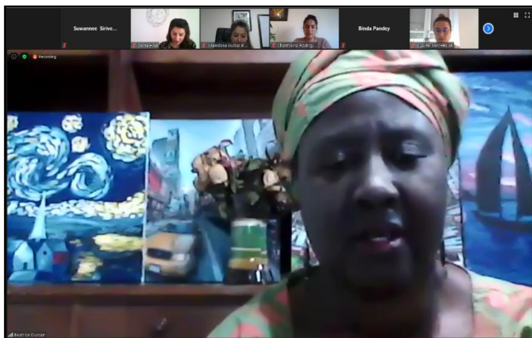
Ms. Beatrice Duncan ที่ปรึกษาระดับโลกของ UN Women ขณะอภิปรายภาพรวมของการออกกฎหมายที่คำนึงถึงมิติทางเพศ

การอภิปรายช่วงที่ ๑ การจัดลำดับความสำคัญของรัฐสภาสำหรับการดำเนินการตามแผนปฏิบัติการปักกิ่ง (Discussion on parliamentary priorities with respect to Beijing implementation)