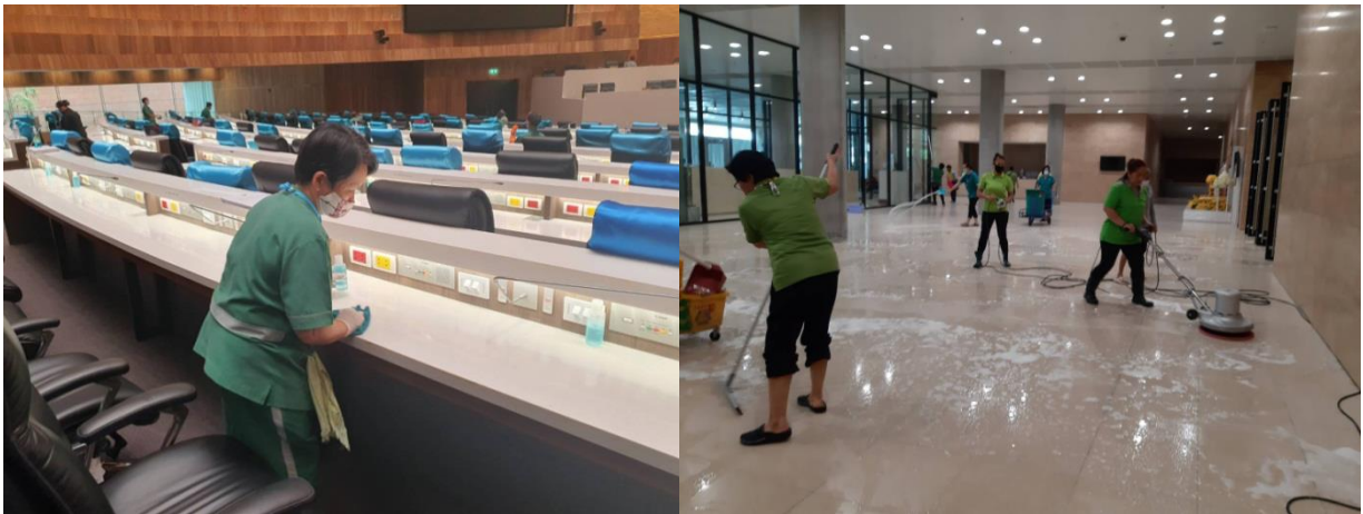
การทำความสะอาด (Big Cleaning) ภายในอาคารรัฐสภา