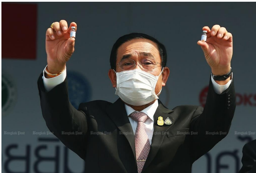
พลเอก ประยุทธ์ จันทร์โอชา นายกรัฐมนตรี แถลงข่าววัคซีนป้องกันโควิด-๑๙ ชุดแรก que จัดส่งถึงประเทศไทย