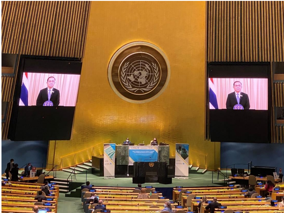
พลเอก ประยุทธ์ จันทร์โอชา นายกรัฐมนตรี กล่าวถ้อยแถลงผ่านวีดิทัศน์ ในการประชุมสมัชชาสหประชาชาติ สมัยพิเศษ ครั้งที่ ๓๑ ว่าด้วยการรับมือกับการแพร่ระบาดของโควิด-๑๙

ในด้านความสัมพันธ์ระหว่างประเทศ รัฐบาลใช้โอกาสในการประชุมผ่านสื่ออิเล็กทรอนิกส์ เพื่อสร้างความสัมพันธ์และความร่วมมือระหว่างประเทศในการจัดการและฟื้นฟูภายหลังยุคโควิด-๑๙ โดยเมื่อวันที่ ๔ ธันวาคม ๒๕๖๓ พลเอก ประยุทธ์ จันทร์โอชา นายกรัฐมนตรีและรัฐมนตรีว่าการกระทรวงกลาโหม กล่าวถ้อยแถลงผ่านวีดิทัศน์ในการประชุมสมัชชาสหประชาชาติ สมัยพิเศษ ครั้งที่ ๓๑ ว่าด้วยการรับมือกับการแพร่ระบาดของโควิด-๑๙ โดยนายกรัฐมนตรีแบ่งปันประสบการณ์ของไทยในการรับมือกับโควิด-๑๙ ได้แก่ ความเข้มแข็งของระบบสาธารณสุขและบุคลากรทางการแพทย์ของไทยโดยเฉพาะอาสาสมัครสาธารณสุขหมู่บ้าน ความร่วมมือจากทุกภาคส่วนในการปฏิบัติตามมาตรการพื้นฐานเพื่อป้องกันการแพร่ระบาด การสนับสนุนการพัฒนาและจัดหาวัคซีนโควิด-๑๙ และประกาศว่า ไทยจะมอบเงินให้แก่องค์การอนามัยโลก (WHO) เพื่อสนับสนุนข้อริเริ่มในการพัฒนาและจัดสรรยาและวัคซีนโควิด-๑๙ ซึ่งต้องเป็นสินค้าสาธารณะที่สามารถเข้าถึงได้อย่างเท่าเทียม และการนำเทคโนโลยีและนวัตกรรมมาบริหารจัดการข้อมูลในพื้นที่รวมถึงการให้บริการทางการแพทย์ทางไกล นอกจากนี้ นายกรัฐมนตรียังให้ทุกประเทศร่วมมือกันเป็นหนึ่งเดียวเพื่อจัดการกับวิกฤตการณ์ครั้งนี้ ไทยและประเทศสมาชิกอาเซียนได้มีมาตรการรับมือกับโควิด-๑๙ ผ่านข้อริเริ่มต่าง ๆ เช่น การจัดตั้งกองทุนอาเซียนเพื่อรับมือกับโควิด-๑๙ การรับรองแผนการฟื้นฟูที่ครอบคลุมของอาเซียน และการจัดตั้งศูนย์อาเซียนด้านภาวะฉุกเฉินทางสาธารณสุขและโรคอุบัติใหม่ ทั้งนี้ นายกรัฐมนตรีได้ให้กำลังใจประเทศที่ยังคงเผชิญกับการแพร่ระบาด และไทยพร้อมร่วมมือกับทุกประเทศเพื่อผ่านพ้นวิกฤตการณ์ครั้งนี้ไปด้วยกัน โดยไม่ละทิ้งใครไว้ข้างหลัง