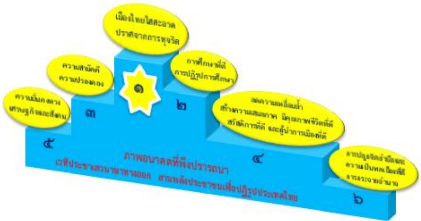
ภาพ ๑ สรุปผลการจัดอันดับข้อมูลภาพอนาคตที่พึงปรารถนาของประชาชนที่เข้าร่วมเวทีประชาเสวนาให้ความสำคัญมากที่สุด

ข้อมูลข้างต้นแสดงให้เห็นว่า เรื่องของการทุจริตยังคงเป็นปัญหาสำคัญของประเทศ โดยสะท้อนได้จากพื้นที่จัดเวที ๘ ใน ๑๐ ที่ระบุถึงความต้องการเห็นเมืองไทยใสสะอาด ปราศจากการทุจริต ภาพอนาคตที่ประชาชนต้องการเห็นและให้ค่าสำคัญซึ่งใกล้เคียงกับเรื่องการทุจริตลำดับถัดมา คือ เรื่องของการศึกษาที่ดีและการปฏิรูปการศึกษา สะท้อนว่า ประชาชนมีความต้องการให้เกิดการพัฒนาให้ถึงระดับตัวบุคคล มองเรื่องการศึกษาเป็นเรื่องสำคัญ ในขณะที่ประเด็นเรื่องความสำคัญและความปรองดองถูกจัดไว้เป็นลำดับที่สาม อย่างไรก็ตาม หากพิจารณาข้อมูลของอันดับความสำคัญในแต่ละประเด็นที่จำแนกตามพื้นที่จัดเวทีแล้ว จะพบว่ามีความแตกต่างกันไปตามบริบทพื้นที่ด้วย ดังแสดงในภาพ ๒